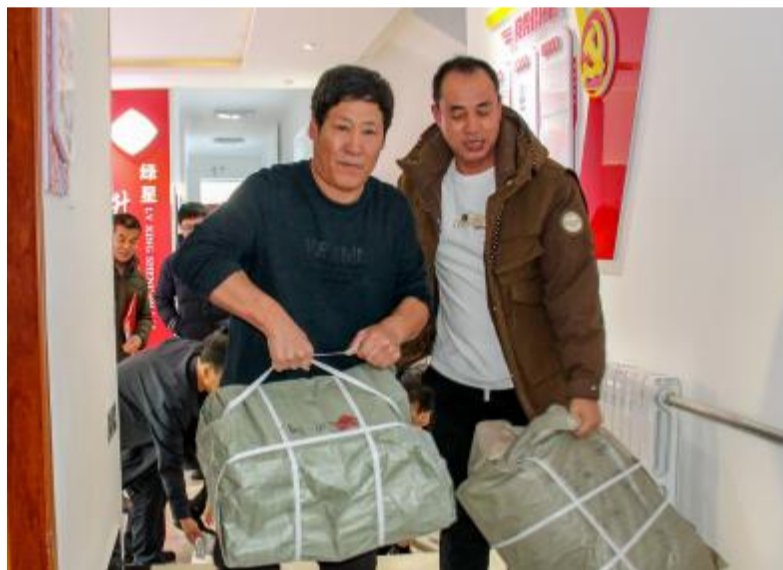
近日,莫尔道嘎森工公司工会深入森林调查设计大队和永红林场新建职工书屋,以及职工服务中心、职工图书馆,为他们送去近1500册各类图书,总价值76000元。

“要继续深化工会改革和建设,牢固树立大抓基层的鲜明导向,夯实基层基础,激发基层活力,不断增强基层工会的引领力、组织力、服务力。要健全已有的组织基础,扩大工会组织覆盖面。要创新工作方式,努力为职工群众提供精准、贴心的服务。工会干部要践行党的群众路线,深入调查研究,及时为职工群众所思所想所盼,不断增强服务职工本领,真心实意为职工说话办事。”近日,习近平总书记在同中华全国总工会新一届领导班子成员集体谈话时发表的重要讲话,深刻阐明了今后一个时期深化工会改革和建设的重点任务,体现了改革永远在路上的时代要求,为新征程上深化工会改革和建设提供了科学指引。 深化工会改革和建设是工会永葆生机活力、当好桥梁纽带的动力所在。时代在发展,事业在创新,工会工作也要发展、也要创新。新时代的工会工作面临着许多新情况新挑战,这就需要各级工会自觉运用改革精神谋划推进工会工作,创新工作体系、工作内容和方式方法,密切同职工群众的联系,倾听职工群众呼声,解决职工群众急难愁盼问题。新征程上,各级工会组织和广大工会干部要紧紧围绕保持和增强政治性、先进性、群众性这一主线,不断深化工会改革和建设,积极构建联系广泛、服务职工的工会工作体系,坚持问题导向,迎刃而上、朝着难点攻,持之以恒、久久为功,在建机制、强功能、增实效上下功夫,把工会组织建设得更加充满活力、更加坚强有力。 基层工会离职工最近,联系职工最直接,服务职工最具体,是工会工作的基础和关键。要从巩固党执政的阶级基础和群众基础的高度出发,健全已有的组织基础,不断扩大工会组织和工会工作覆盖面。要树立大抓基层的鲜明导向,坚持落实到基层、落实到基层理念,实施大抓基层三年行动,建立健全纵横交织、条块结合的工会组织体系,坚持眼睛向下、面向基层,努力把工作做到所有职工群众中去,把包括新就业形态劳动者在内的广大职工最大限度地组织到工会中来。要持续推进新经济组织、新社会组织、新就业群体建会入会工作,加强工业园区(区)、乡镇(街道)、村(社区)工会、区域性