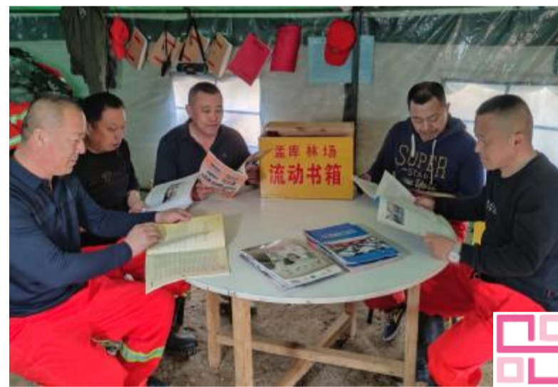
近日,满归森工公司孟库林场工会开展“流动书箱”进队段、班组图书漂流活动。因为一线职工津津有味地阅读书籍。