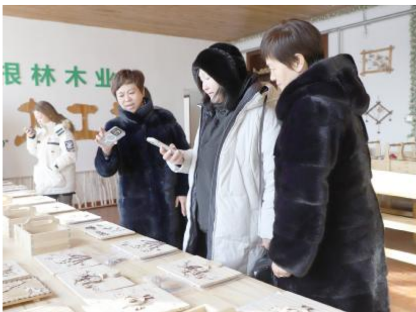
近日,俄罗斯研学机构到根河森工公司对接交流自然教育研学项目,详细了解公司的研学课程、食宿环境,并探讨下一步的合作事项。图为俄罗斯研学机构工作人员观看自然教育研学项目中的手工作品。