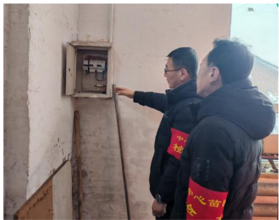
近日，满归森工公司中心苗圃安全专职人员对苗圃山下办公室及车库进行无死角安全大检查，消除消防安全隐患，最大程度减少和消除火灾事故的发生，为苗圃安全稳定奠定了坚实基础。