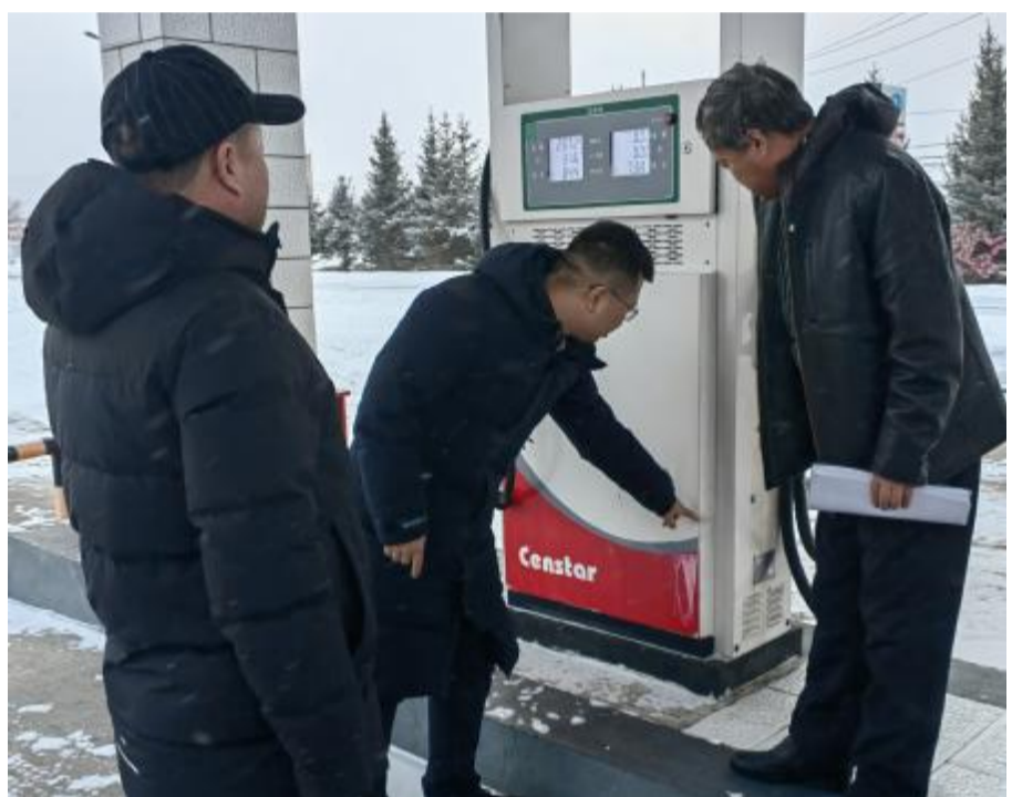
近日，图里河森工公司燃料供应处组成工作组到加油站、油库开展安全检查，对成品油的存储设施、安全措施以及应急预案进行检查，确保在发生意外情况时能够及时采取有效的应对措施。同时与工作人员进行交流，强调安全工作的重要性，并听取他们对安全工作的建议和意见。经过安全检查，不仅强化了成品油存储的安全管理，还增强了职工对安全工作的理解和自我保护意识，为公司安全工作提供坚实保障。