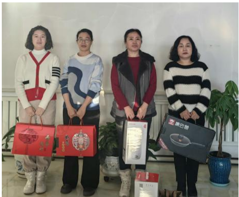
近日，阿里河森工公司物资供应中心党支部组织开展“亮风采 晒成果 互比较”党建品牌活动。党员通过“亮”职责任务，“晒”工作成效，“比”贡献担当，并从综合评价、工作实绩、工作创新和参与中心工作四个方面对党员进行现场打分，最终评选出名次，颁发奖品。通过活动营造比学赶超、争当先进的良好氛围。图为获奖党员合影。