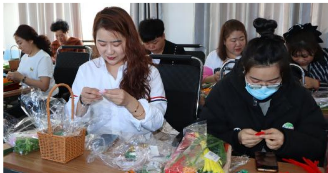
为庆祝第114个“三八”国际劳动妇女节,3月1日,库都尔森工公司工会开展了“巧手庆三八 编织幸福花”主题手工制作活动,丰富女职工业余文化生活,营造欢乐的节日氛围。

嫂、护理等职工家属培训,为困难职工家庭提供技能服务;在工会办公楼内搭建电子图书阅览室,配备可触式电子图书阅读器及蓝牙耳机,为职工提供除文字、图片外的可视听多元化信息资源;持续开放职工“爱心”驿站和暖心便利店,为职工提供暖心服务;组织开展健步走、登山、乒乓球、羽毛球等形式多样的体育活动,缓解职工工作压力,丰富职工文化生活,营造积极向上、工作生活氛围。