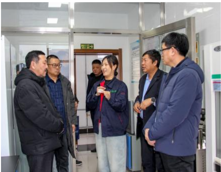
日前，呼伦贝尔市总工会、红塔尔基林业局工会组成观摩组，到莫尔道嘎森工公司工会观摩交流，就建设示范性工会进行对标学习，在相互交流中促进工会工作水平提升。

会上，各方代表共同签署《内蒙古森工集团·漠河市人民政府·根河市人民政府·额尔古纳市人民政府——旅游发展战略合作协议》《漠河林业局·满归森工公司·莫尔道嘎森工公司、北部原始林区森林管护局、额尔古纳国家级自然保护区管理局——旅游发展战略合作协议》。会前，与会人员还到牙克石凤凰山景区进行实地调研。