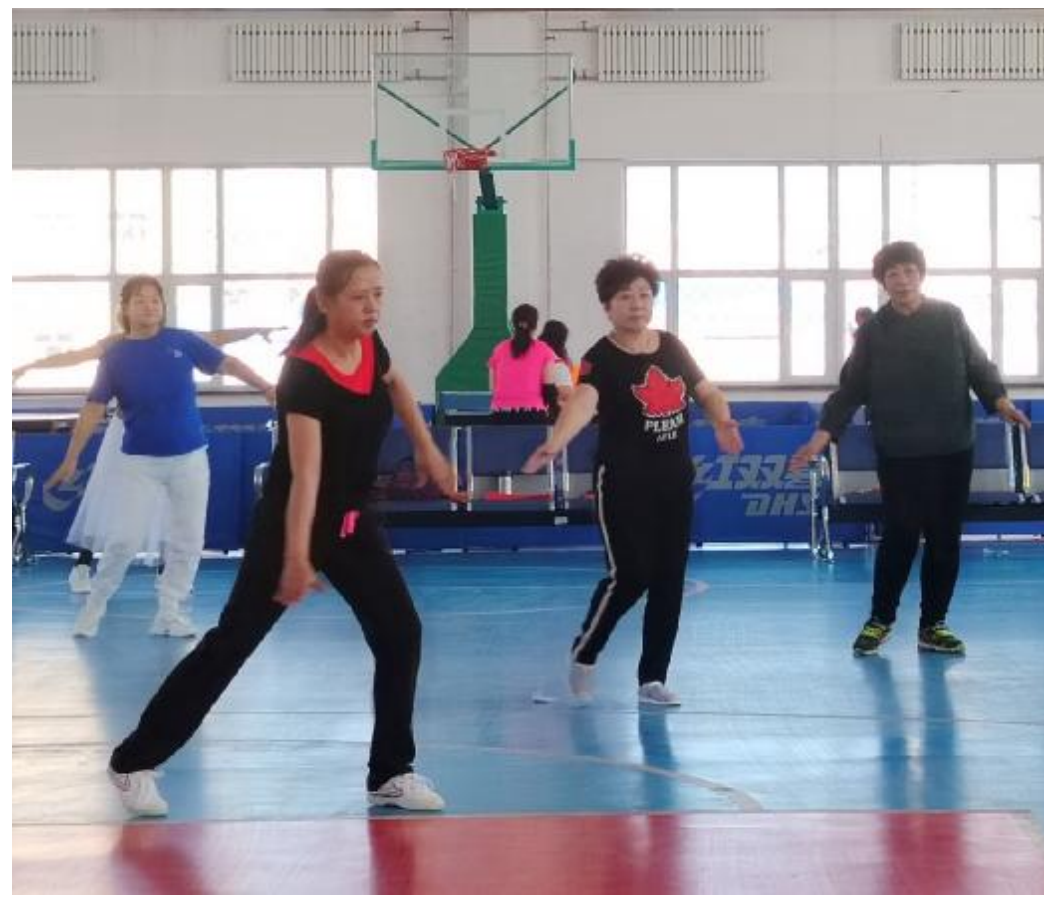
今年以来,阿龙山森工公司推动全民健身活动持续开展,丰富了职工群众业余文化生活,职工群众获得感、幸福感不断提升。