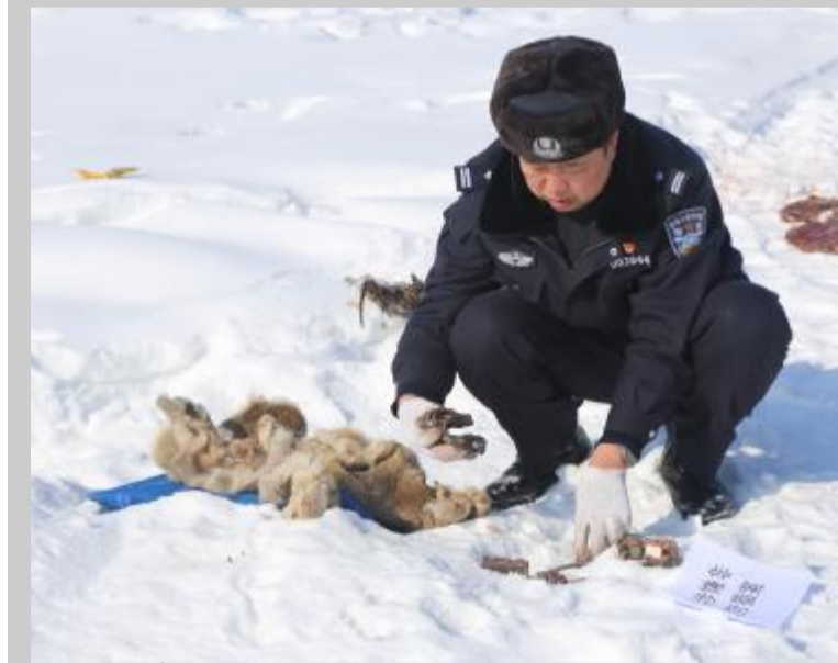
3月12日,内蒙古大兴安岭森林公安局乌拉旗分局生态环境保护和刑事侦查大队按照涉野生动物处置工作相关规定,依法集中销毁一批涉案野生动物尸体及其制品。

销毁过程中,民警将涉案野生动物尸体及制品进行清点、核对,建立销毁清单,随后到销毁场地集中销毁。