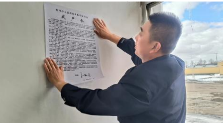
近日,阿龙山森工公司先锋森林经营管护中心在办公楼张贴了森林草原防火戒严令,加强森林草原防火工作,切实保障人民群众生命财产安全和森林草原资源安全。