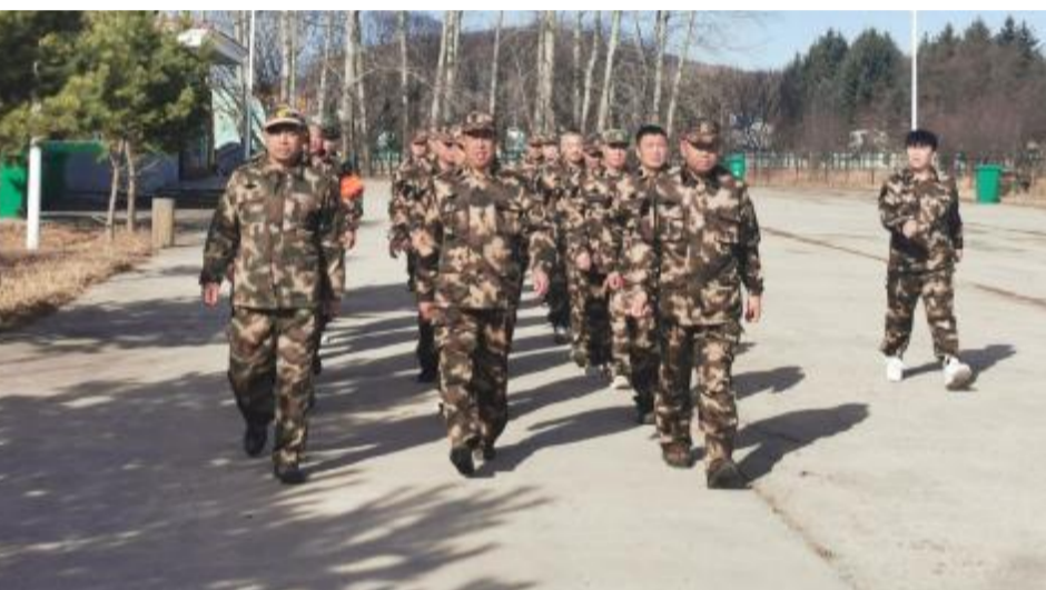
进入春季防火关键时期,乌尔旗汉森工公司温库图林场组织防火队员全身心投入体能训练中,时刻保持备战状态。

本报讯(通讯员 尹向南)近日,图里河林业局宾馆组织女职工开展“春暖半边天 知识快乐传”趣味答题活动,答题内容包括古诗、成语、名人著作、字词、歇后语等文学知识。