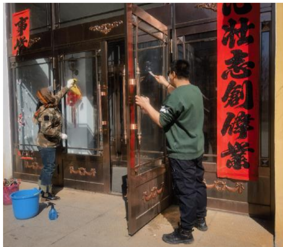
近日,大杨树林业有限公司中心苗圃开展爱国卫生月活动,组织职工清理办公楼和园区内卫生,营造了“人人参与、人人动手”的浓厚氛围。

此外,该公司还定期举办各类健康讲座和培训,持续强化健康管理工作,从源头上预防和减少职工健康问题的发生。