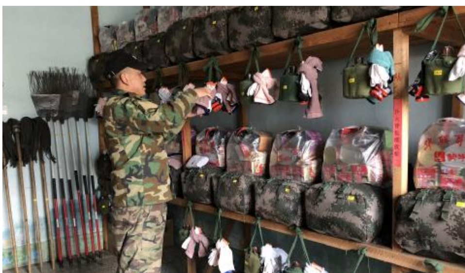
连日来,阿龙山森工公司先锋经营管护中心开展森林防火各项工作,确保关键时刻能“拉得出、用得上、打得赢”。图为配备防火器材。

据了解,该应急事务处本着“以老带新、以新促老、教学相长”的初衷,帮助新队员迅速从“新兵”蝶变成“精兵”,让队伍的业务能力和团队凝聚力有效提升,推动专业森林消防队伍现代化建设。