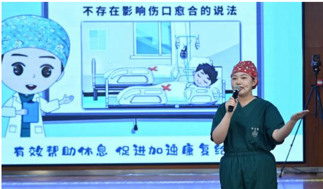
5月6日,来自麻醉科的护士表演说唱《镇痛泵的秘密》。当日,在第113个国际护士节来临之际,北京大学人民医院举行庆祝“5·12”国际护士节暨优秀集体和个人表彰大会。

生物多样性锐减等紧迫挑战。 “现在比以往任何时候都更需要表彰那些治愈地球的解决方案,‘保尔森奖’将致力于加速全球向零排放转型,推动自然向好的未来作出贡献。”保尔森基金会副主席兼总裁戴青丽说,通过该奖项,期待与所有合作伙伴和创新者们携手推动可持续创新。 “保尔森奖”由保尔森基金会于2013年发起,自2017年起与清华大学联合主办,是可持续发展领域最具影响力的国际奖项之一。该年度奖项表彰中国境内具有创新性、可复制性、兼具经济和环境双重效益的解决方案,以应对全球最为紧迫的气候和生物多样性挑战。