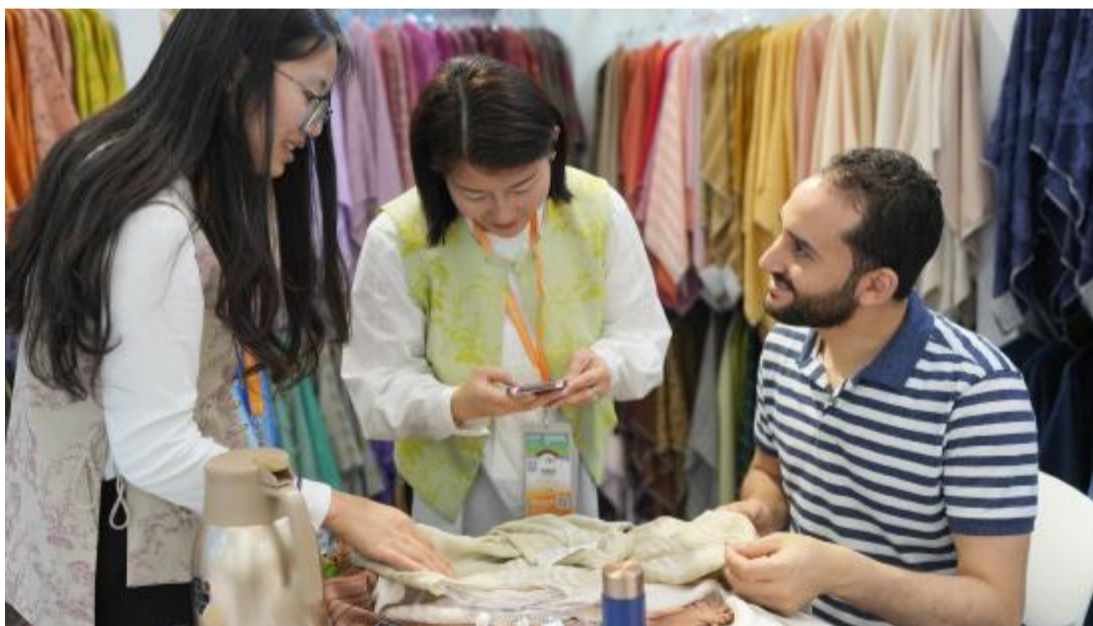
5月6日,一名来自埃及的客商在博览会上选购面料。当日,2024中国绍兴柯桥国际纺织品面料博览会(春季)在浙江省绍兴市启幕。本届博览会共设展位1400余个,参展企业600余家,展览面积3.5万平方米。