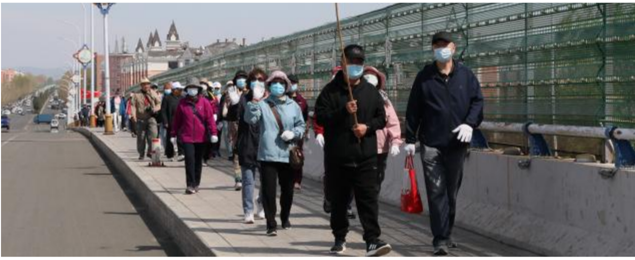
5月21日，林区老科协举办2024年“绿色环保步行”活动。100余人从老干部活动中心出发，向着牙克石市喜桂图公园行进。活动中，大家在喜桂图公园义务清除垃圾，并为市民表演了小合唱、舞蹈等节目，增强公众绿色环保意识。