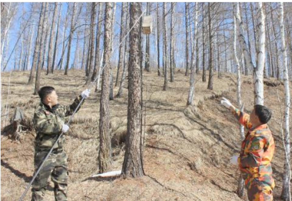
近日，克一河森工公司开展人工鸟巢箱清巢工作，提高食虫鸟的招引率和筑巢率。图为森防站工作人员清理鸟巢箱。