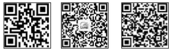
绿网 林海日报官方微信 林海日报官方微博