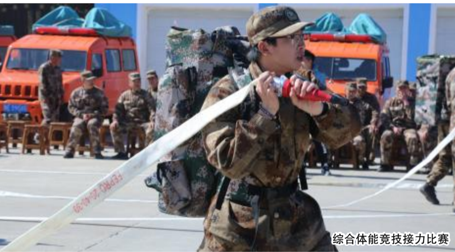
综合体能竞技接力比赛