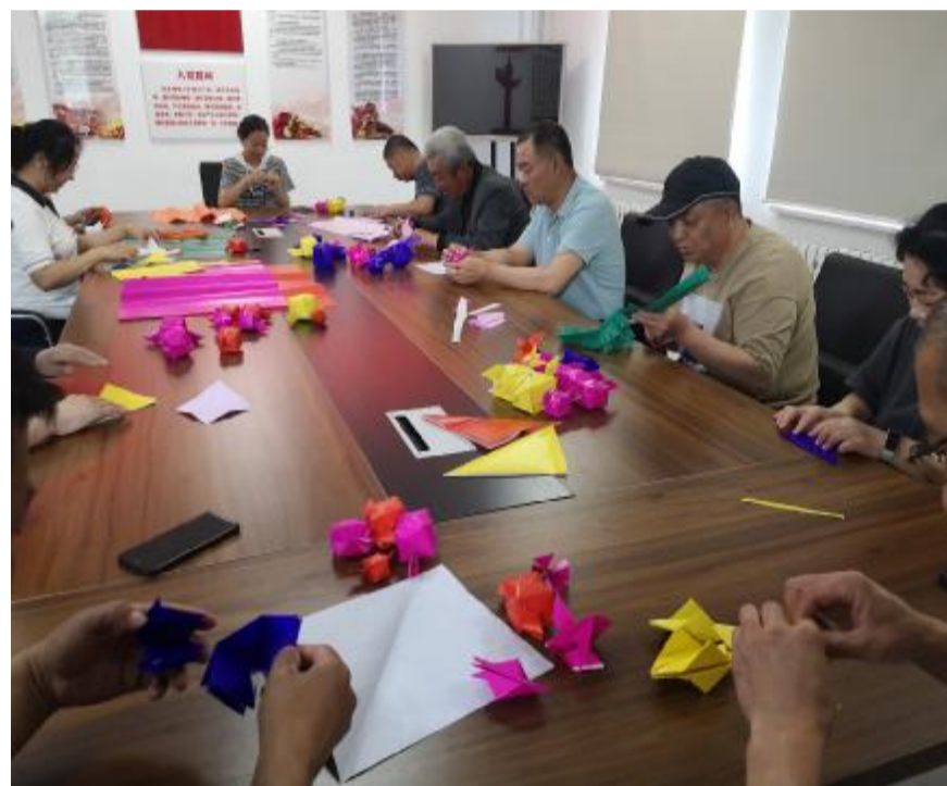
6月5日,图里河林业技工学校开展“浓情端午 传承文明”折葫芦迎端午活动,让教职工领略中华优秀传统文化的深邃内涵,不断增强爱国情感。

本报讯(通讯员 卜丽娟)近日,库都尔森工公司哈牙世德林场开展禁毒宣传活动,通过设立宣传展板、歌唱禁毒歌曲、发放禁毒宣传资料、现场解答禁毒常识等形式,增强群众防范毒品意识。