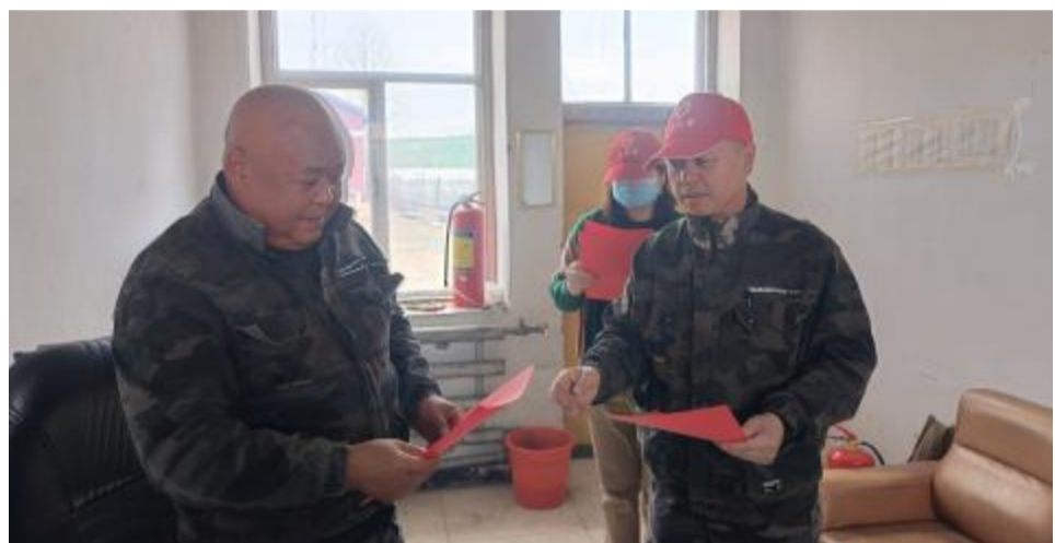
日前,金河森工公司萨河林场开展民族政策宣传活动,组织人员深入队段及居民家中发放民族政策宣传册,推动党的民族政策宣传工作走深走实,促进各民族交往交流交融。