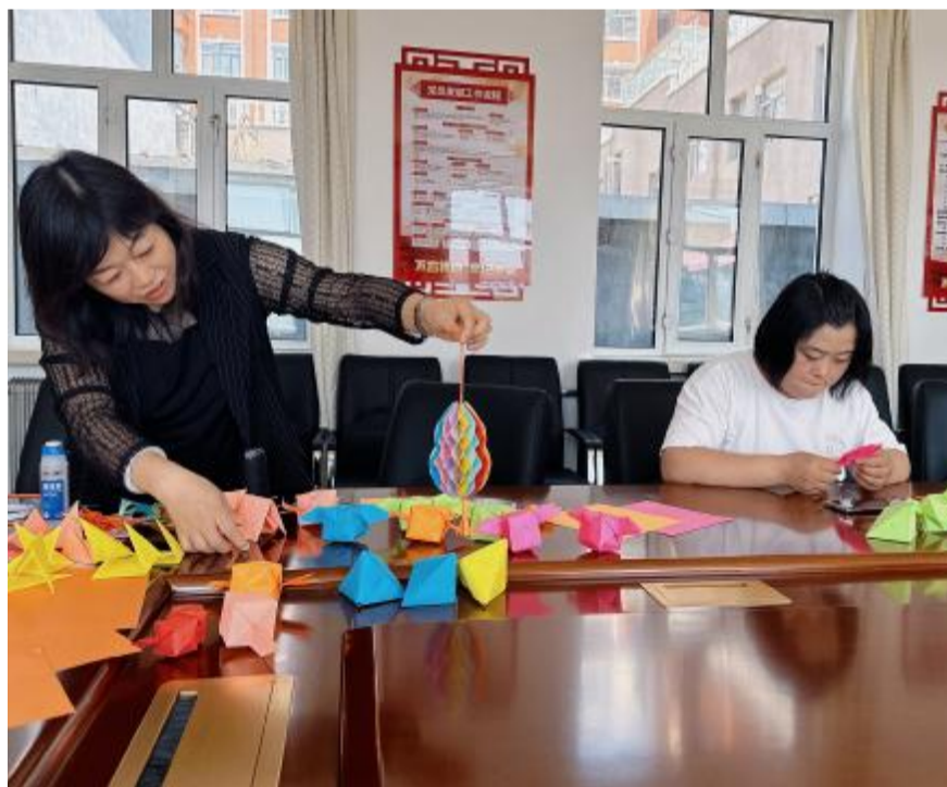
6月5日,毕拉河林业有限公司综合服务处开展“我们的节日·端午”剪纸叠葫芦活动,弘扬中华民族传统文化,增强民族自豪感。