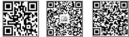
绿网 林海日报官方微信 林海日报官方微博