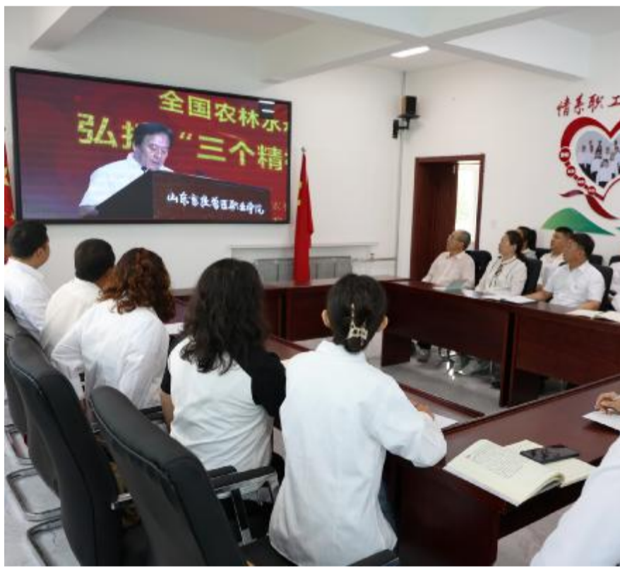
6月26日,锦源森工公司工会组织机关干部职工收看全国农林水利气象系统弘扬劳模精神、劳动精神、工匠精神宣讲活动视频,激励干部职工做“三个精神”的践行者,为公司绿色高质量发展贡献智慧和力量。

饱含深情,深刻表达了对祖国、家乡的依恋与忠诚;舞蹈《春颂》《敬鲁古雅》,表演者身着民族服饰,伴着悠扬的曲子,翩翩起舞,表达出各民族一家亲的深厚情感。现场掌声雷动、气氛热烈,每个精心编排的节目都深深牵动着在场观众的心,最后,演出在歌舞节目《永远是一家人》中落下帷幕。 不忘初心向党,百年征程再起航。此次活动是乌尔旗汉森工公司党委推动企业文化高质量发展的重要举措,对凝聚广大干部职工奋进力量具有十分重要的现实意义。多年来,“黎明之夏”广场文艺演出已成为该公司党委打造特色文化品牌和促进林地共建的重要载体,更是增进各族干部职工群众文化认同、铸牢中华民族共同体意识的有效依托。林地双方坚持“一片林、一家人、一个目标、一条心”的理念,携手推动乌尔旗汉地区各项事业繁荣发展。