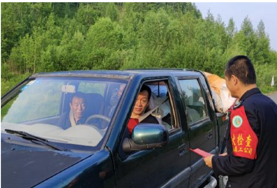
近期,阿龙山森工公司森林资源管理中心组织各管护站职工为过往车辆发放宣传单,向职工群众宣传保护林下资源的相关知识和政策法规。