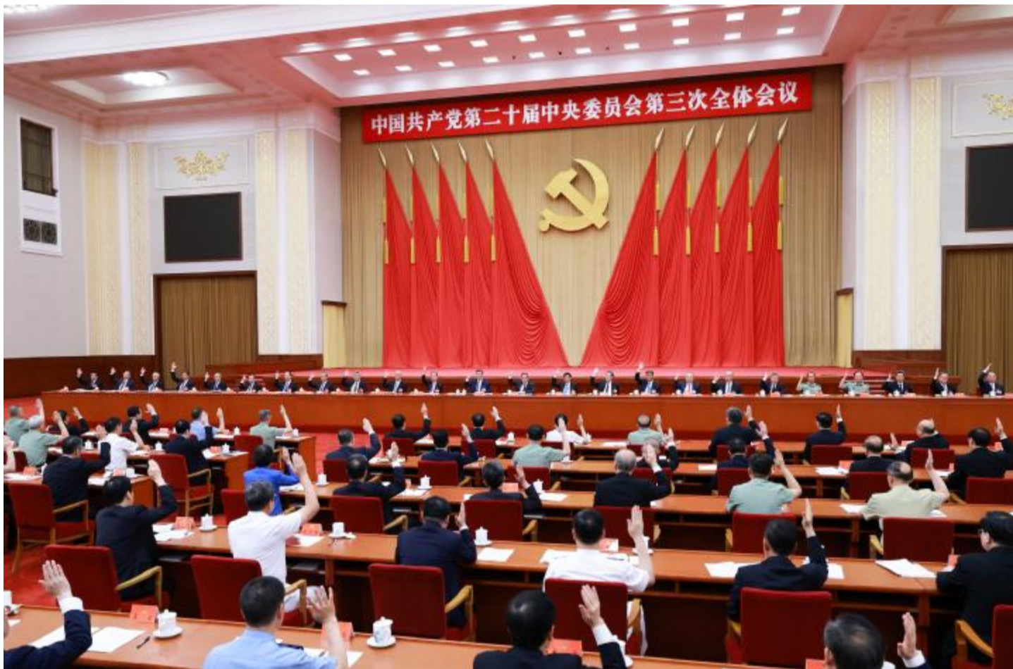
中国共产党第二十届中央委员会第三次全体会议,于2024年7月15日至18日在北京举行。中央政治局主持会议。