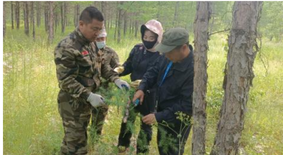
近日,克一河森工公司森防站开展落叶松癌肿病原孢子调查工作,掌握孢子在病部组织中的数量,便于评估病害的严重程度和发展趋势。 ■ 杨柳 薛广军 摄