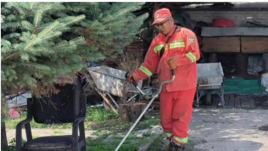
连日来,阿里河森工公司贮木中心组织职工对院内的树木和杂草进行修剪,对办公区域内外地面、桌面、门窗进行细致打扫,营造干净、整洁、优美的办公环境。图为职工清理院内杂草。

本报讯(通讯员 陈伟祥)近日,阿里河森工公司自然保护区管理中心开展以“警惕诈骗新手法,不做电诈工具人”为主题