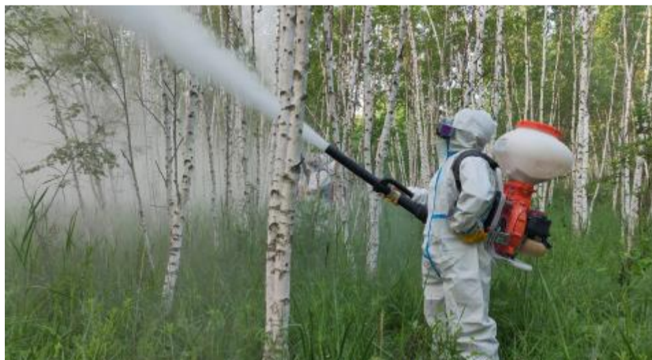
近日,毕拉河林业有限公司森防站开展桦树黑斑病防治工作,有效控制桦树黑斑病蔓延。图为技术人员为桦树喷药粉。