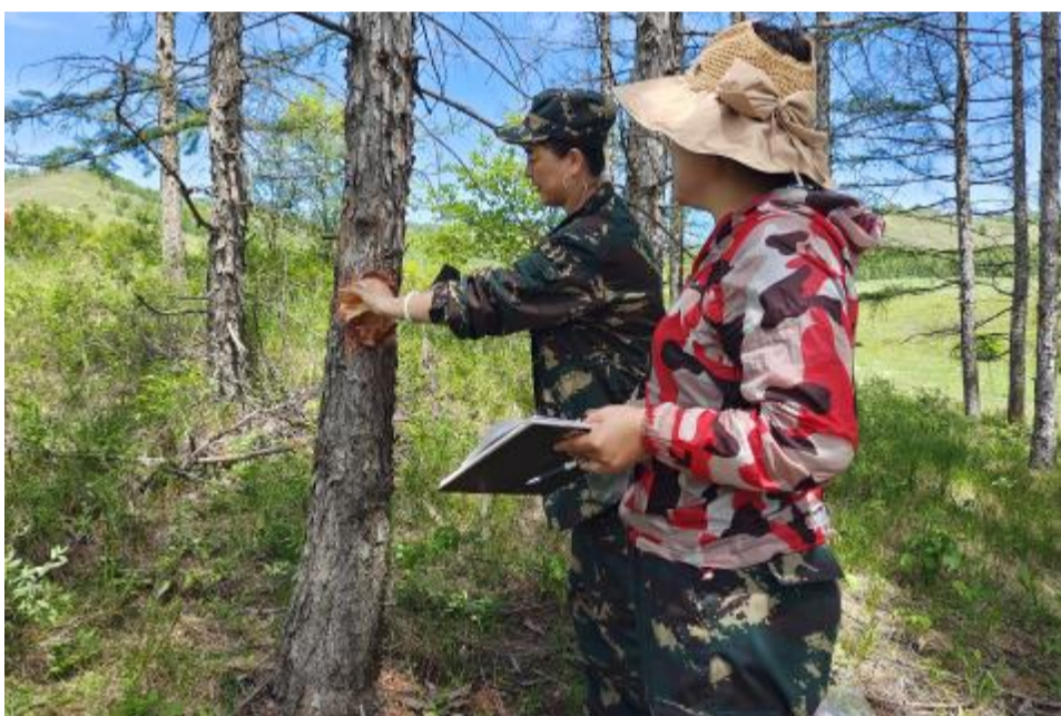
近期,莫尔道嘎森工公司森防站开展松材线虫病调查监测工作,观察松林生长变化,及时掌握松材线虫病疫情,确保森林资源安全。图为技术人员对枯死树进行取样。

截至目前,该站已完成防治面积2300亩。下一步,他们将开展虫情监测和防后效果调查工作,确保高质量完成林业有害生物防治各项工作任务。