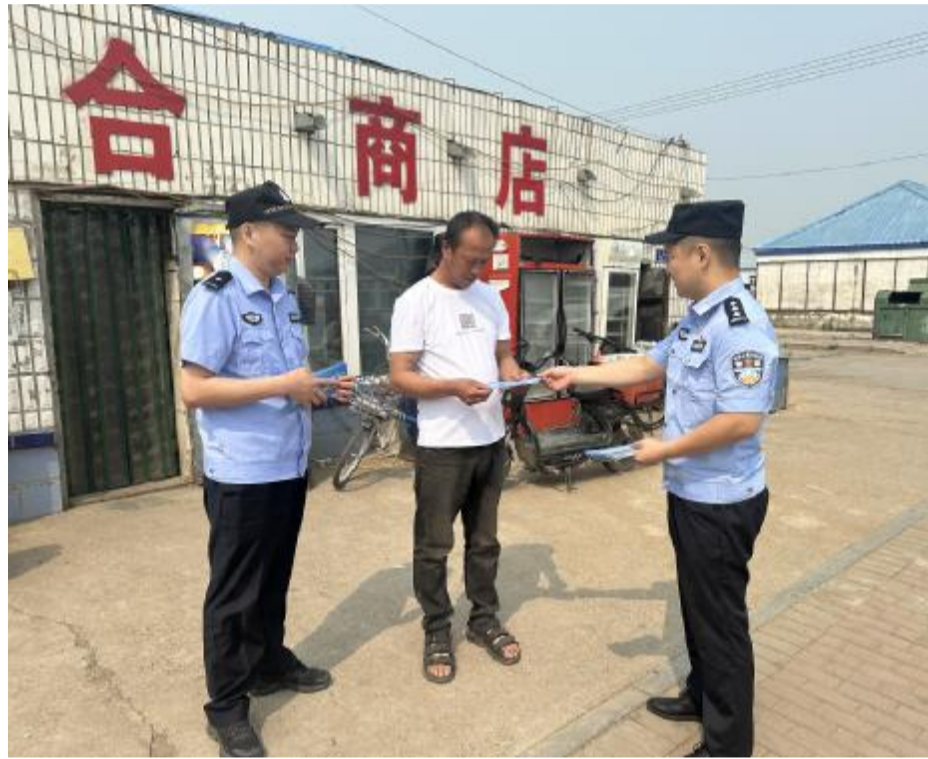
7月19日,内蒙古大兴安岭森林公安局大杨树分局古里派出所组织开展防电信诈骗宣传活动,通过发放宣传资料、张贴宣传海报,引导群众下载国家反诈中心APP、讲解受骗案例等方式,让群众深入了解各类诈骗手法,增强防范意识。

本报讯(通讯员 米洋)近日,内蒙古大兴安岭森林公安局阿里河分局兴安派出所执行“夏季行动”巡逻任务途中,发现一名外地自驾游车辆轮胎漏气,导致车辆无法前行,民警及时伸出援助之手,并护送车辆驶出林区。