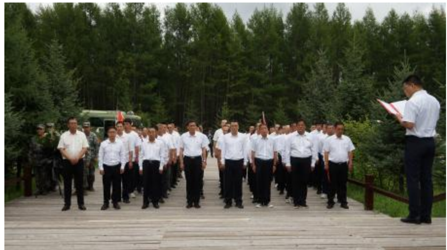
7月27日,根河森工公司应急事务中心党支部和伊图里河林业有限公司应急事务中心党支部联合开展“传承红色基因 践行绿色使命”主题党日。全体党员来到崔曾女纪念馆,学习优秀共产党员崔曾女艰苦朴素、无私奉献、爱岗敬业的先进事迹,并向崔曾女雕像敬献了花篮,推动党纪学习教育走深走实。

全面自查自纠,排查可能存在的廉洁风险点,制定有针对性的防控措施,建立动态台账,常态化督促检查,做到早纠正、早处置,筑牢干部职工廉洁思想防线;组织党员干部到公司廉洁文化宣教室、文化长廊参观学习,签订“八小时以外”廉洁自律承诺书,观看廉政警示教育片,以典型案例为“镜”,让党员干部始终保持对纪律的敬畏之心。