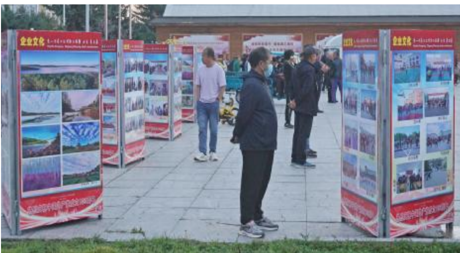
近日，克一河森工公司举办职工摄影、书法、美术展，共展出作品191幅，展示公司在生态保护、产业发展、民生改善等工作中取得的成就，展现了各行各业干部职工昂扬向上的精神风貌。

无人机巡查机动性强、灵活度高、覆盖面广等优势，开展高空大范围巡查，发现可疑地点后，徒步到现场排查核实。通过无人机与人力的高效联动配合，在节省人力物力的同时，全力提升了禁种铲毒踏查行动的精准度和巡查效率，做到排查不留死角、铲毒不留盲区。同时，向职工群众发放禁种铲毒宣传传单，现场讲解毒品的危害、识毒防毒常识以及禁种铲毒相关法律法规，切实增强职工群众禁种铲毒意识，营造全民拒毒、全民禁毒的良好社会氛围。