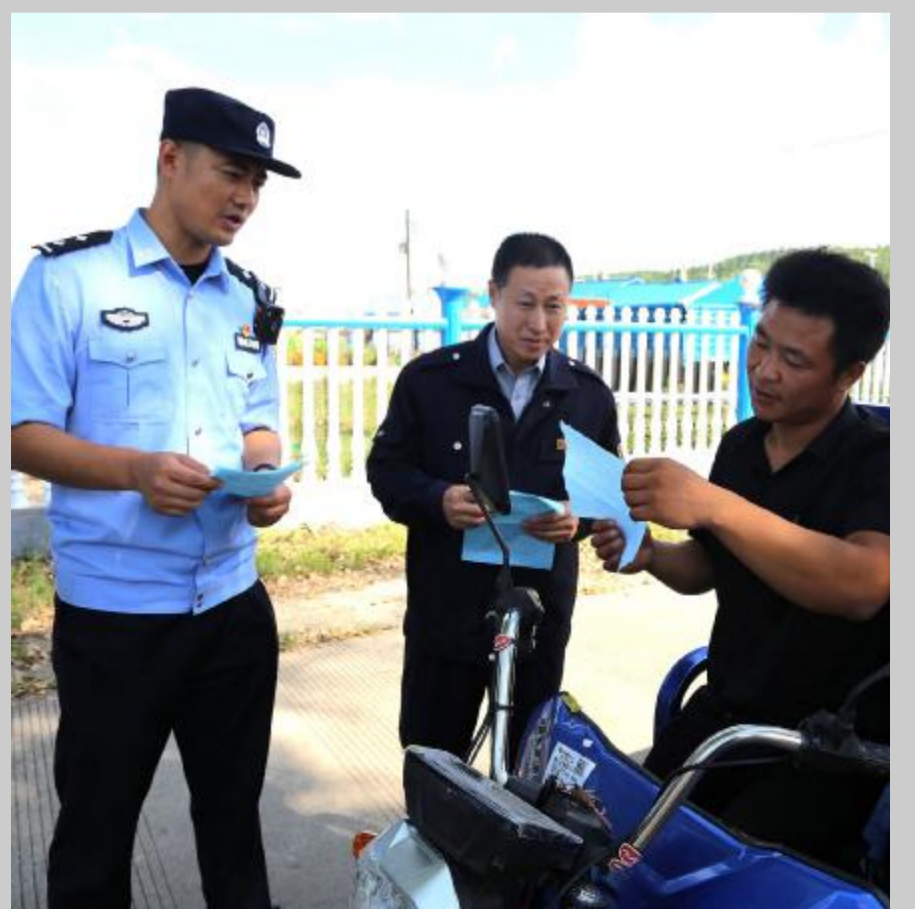
近日，大杨树林业公司朝阳林场与内蒙古大兴安岭森林公安局大杨树分局刑侦生态大队、扎兰河农场社区联合开展“共建生态文明 携手推进全面绿色转型”主题党日活动。活动中，工作人员深入辖区，通过悬挂宣传条幅、发放宣传资料、现场讲解等形式，向过往群众普及环境保护相关法律法规，讲解生态环境保护的重要性，积极引导群众提高法律意识及生态环境保护意识，共同维护美好家园。