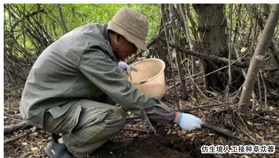
仿生境人工接种草苳蓉