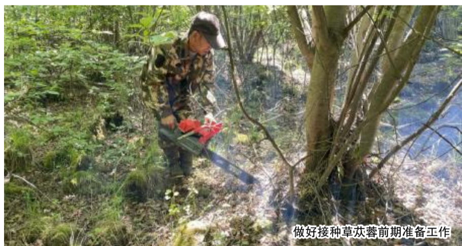
做好接种草苳蓉前期准备工作