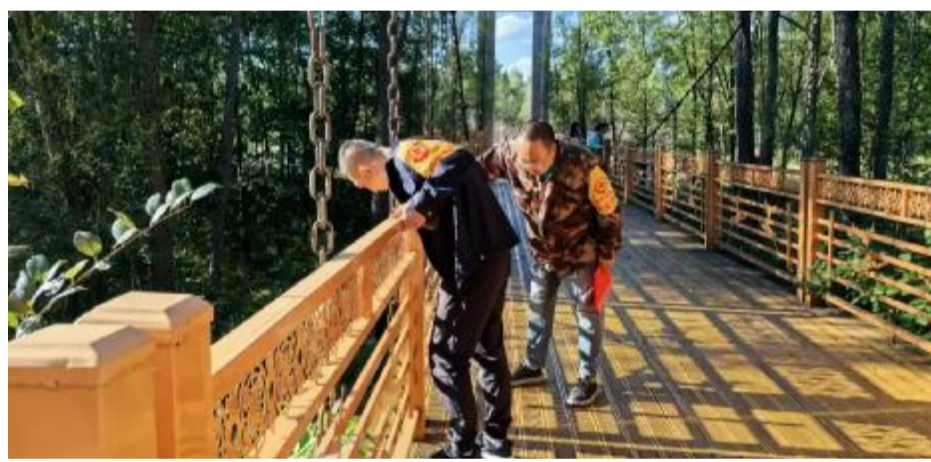
8月28日,克一河森工公司旅游发展中心对兴安国家森林公园、诺敏山庄进行消防安全检查,重点排查用火、用电、消防设施是否存在安全隐患,防范和遏制安全事故发生。

本报讯(通讯员 邢春艳)今年以来,莫尔道嘎森工公司修运中心加强民主管理,发挥职工参与民主管理、民主监督、民主决策的积极性和主动性,引导职工为企业发展贡献力量。