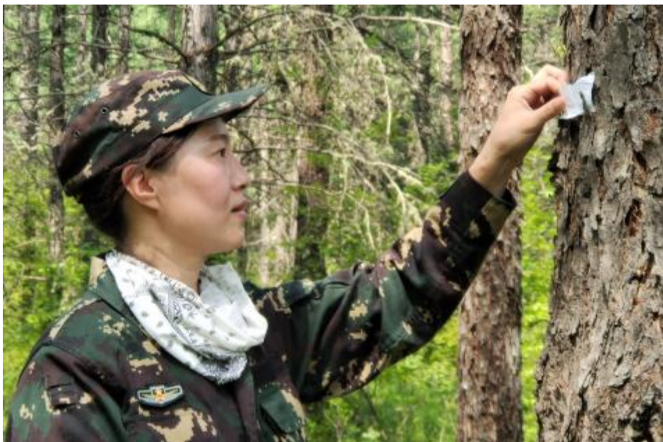
连日来,莫尔道嘎森工公司森防站采用“以虫治虫”的方式,将1.47万余张赤眼蜂卵卡投放在红旗五支2448亩落叶松毛虫发生地,有效控制林业有害生物生长蔓延。 图为工作人员将赤眼蜂卵卡固定在树干上。 ■ 赵建新 摄

员在扎兰屯生态功能区落叶松毛虫发生地18林班悬挂7800卡赤眼蜂卵卡进行防治,防治作业面积1300亩,有效控制了落叶松毛虫的种群和密度,实现“以虫治虫”生物防治目标。