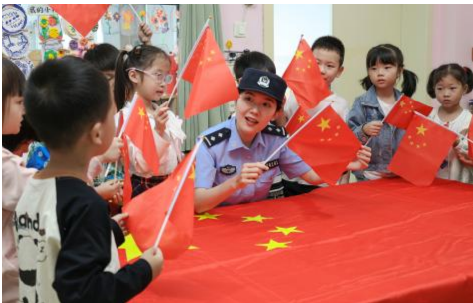
9月25日,浙江省台州市三门县公安局珠岙派出所民警在镇中心幼儿园给小朋友讲国旗知识。国庆节临近,人们通过形式多样的活动,表达对祖国的祝福。

汉堡国际风能展是全球风能行业的重要展会和交流平台,自2014年起每两年举办一次。本届展会将持续到27日。