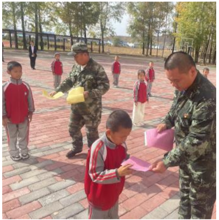
近日，大杨树林业公司朝阳林场组织人员深入扎兰河小学开展森林防火进校园宣传活动，为学生发放宣传册，展示灭火装备，讲解森林防火相关知识，鼓励学生们把森林防火宣传知识传递给亲友，引导他们充分认识森林防火的重要性。