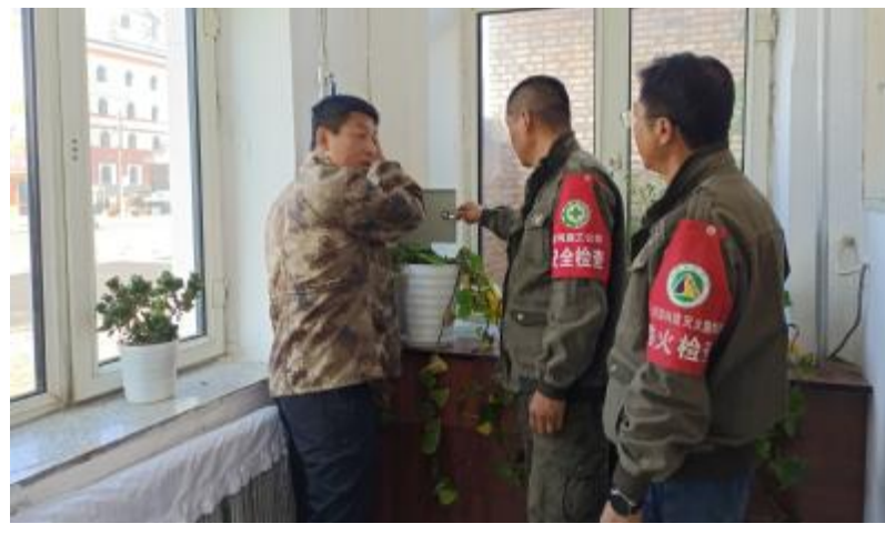
近日,金河森工公司嘎拉牙经营管护中心加强办公楼、车库、物资储备库等重点区域的安全检查,把安全隐患消除在萌芽状态。图为安全员在检查用电设施。