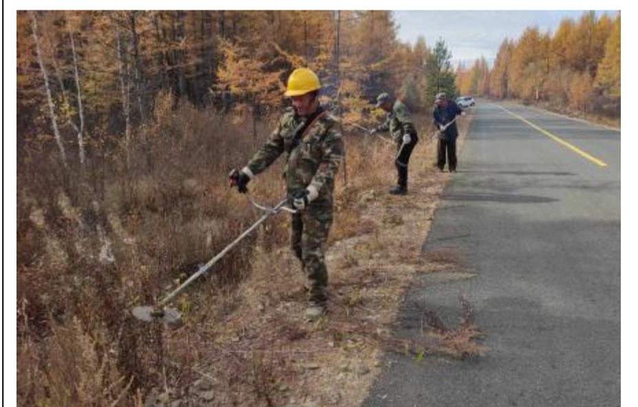
近日,金河森工公司产业发展中心对根满公路两侧杂草进行割灌作业,消除火灾隐患,确保森林资源安全。