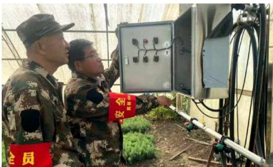
近日,莫尔道嘎森工公司中心苗圃开展防火安全检查工作,对查出的隐患要求责任部门在规定期限内完成整改,真正做到防患于未然。图为检查组对圃地用电安全、消防设施等进行检查。

强化载体建设,拧紧意识形态“安全阀”。该林场党支部加强网上舆论管理,做好重要节点和敏感时期的网络安全保障和舆论监管,指定专人负责微信工作群和舆情信息监控,明确发布信息的内容范畴,维护网络意识形态安全;对党支部微信工作群登记注册备案,确保宣传阵地健康、规范、有序。