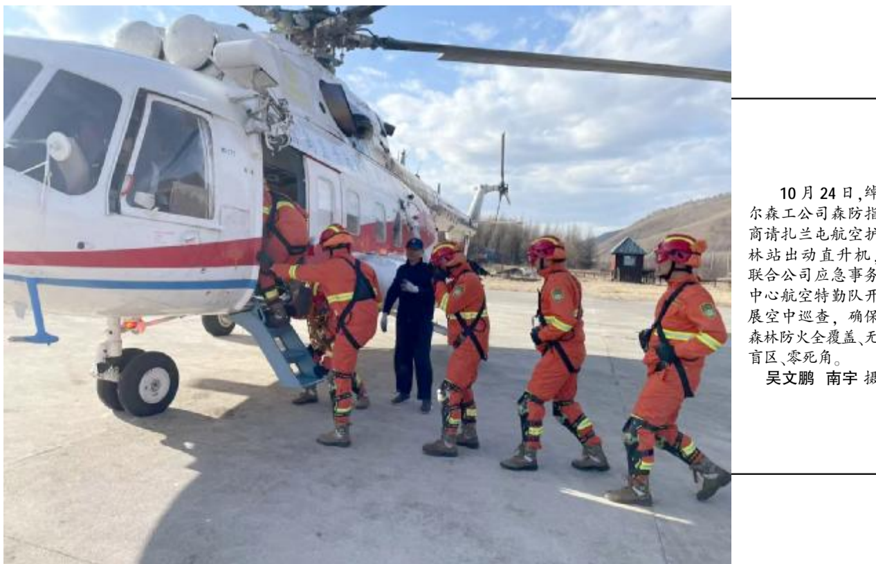
10月24日，额尔森工公司森防指商请扎兰屯航空护林站出动直升机，联合公司应急事务中心航空特勤队开展空中巡查，确保森林防火全覆盖、无盲区、零死角。