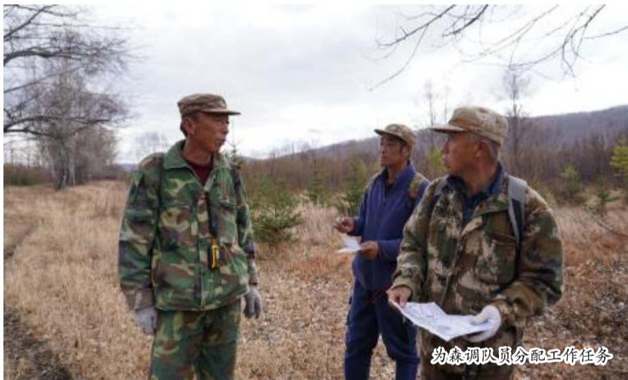
为森调队员分配工作任务