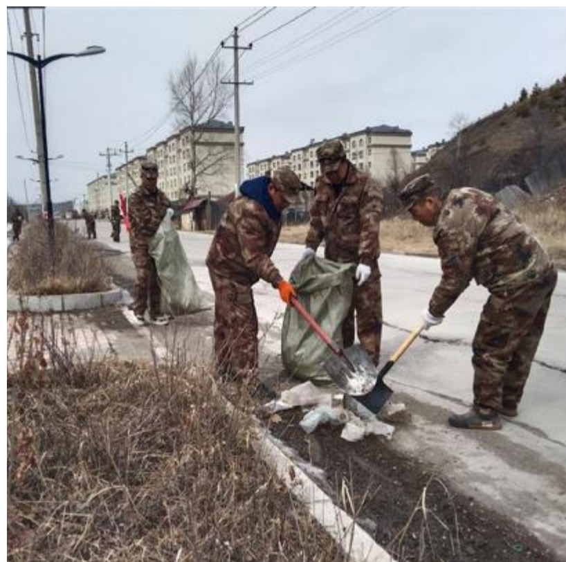
近日,根河森工公司应急事务中心开展“文明实践我是行动者”主题志愿服务活动,组织“石榴籽志愿服务队”“党员突击队”50余名志愿者清理单位辖区和包片地段道路两侧垃圾,营造干净、整洁、优美的卫生环境。

本报讯(通讯员 王哲)近日,库都尔森工公司应急事务中心对新入职扑火队员进行森林防灭火专业技术培训,由经验丰富的老队员演示风力灭火机的启动、握持姿势、移动方式等基础操作,确保新队员掌握灭火技能。