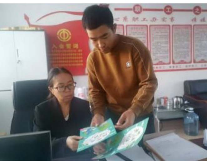
近日,金河森工公司牛耳河经营管护中心开展“普法宣传”入基层活动,通过发放普法宣传材料、开展普法问答等形式,为职工普及法律法规知识,进一步增强职工的法治观念。

该综合服务中心党支部开展廉洁风险点排查工作,根据职能和权限、工作程序、业务流程、制度机制等方面全面排查廉洁风险点并制定防范措施,签订廉洁风险防控承诺书,与关键岗位人员进行廉政提醒谈话,督促他们立其身,尽其职,担其责。