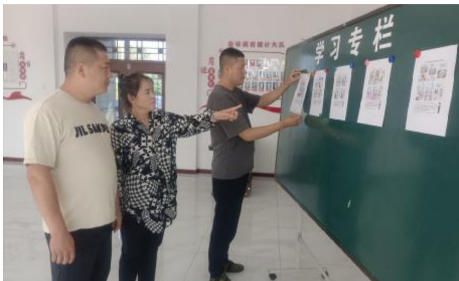
近日,克一河森工公司森林调查设计大队开展廉洁文化宣传活动,通过在宣传栏上张贴一幅幅生动形象、寓意深刻的廉政漫画,引导职工自觉抵制不良诱惑,坚守廉洁底线。

倡廉警示教育基地,用身边事教育身边人,引导党员干部以案为鉴,筑牢思想上的“防腐墙”,增强政治上的“免疫力”,坚守“底线”,不越“红线”,自觉扣好廉洁从政“第一粒扣子”。