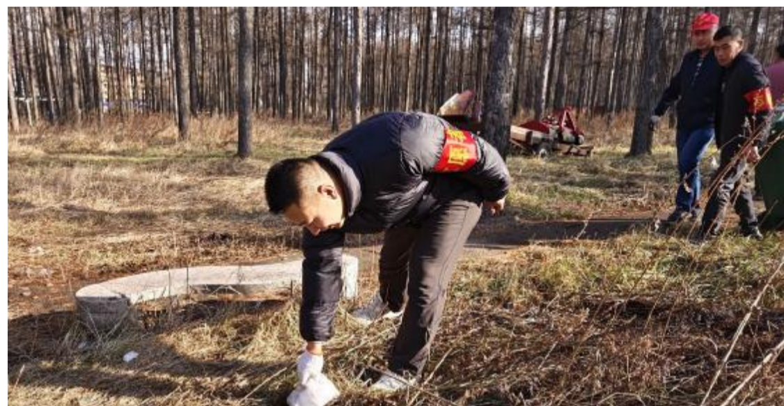
近日，阿尔山森工公司边境经营管护中心团支部开展“我是青年志愿者 我帮你”新时代文明实践志愿服务活动。团员青年来到中心附近的健身林，捡拾塑料袋、烟蒂、纸屑等垃圾，共建共享美好环境。