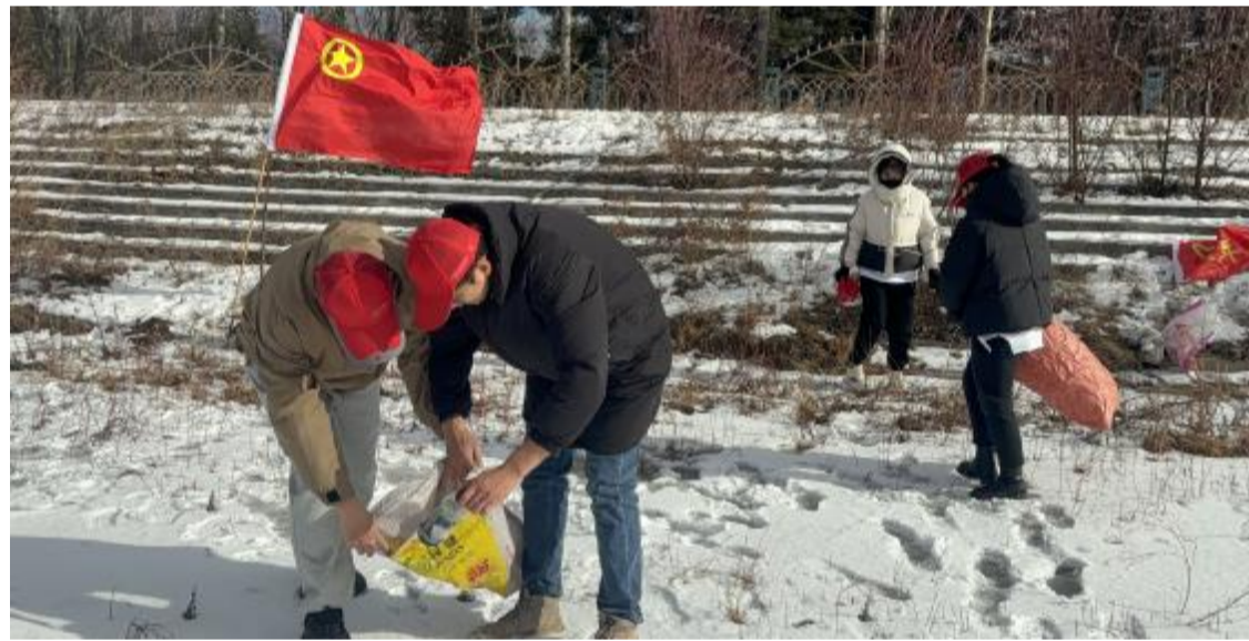
近日，克一河森工公司森林经营中心团支部组织开展志愿服务活动。青年志愿者对河道及岸边的生活垃圾进行全面清理，并将水泥路面沙石清扫干净，确保行人、车辆安全通行，用实际行动保护生态环境。

人生何处不清欢？清欢只合平常心。只要我们心中淡然，心存欢喜，心蓄光亮，即使在平常琐碎的日子里也能发现清欢、享受清欢、分享清欢，拥抱世界与生命的无限美好。