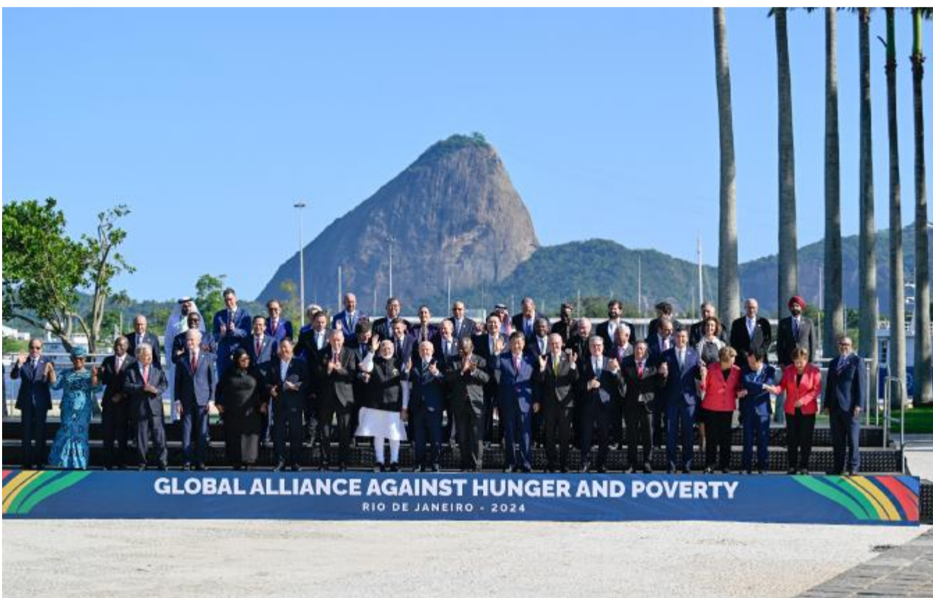
当地时间11月18日上午，国家主席习近平在巴西里约热内卢出席二十国集团领导人第十九次峰会。峰会把“构建公正的世界和可持续发展的星球”作为主题，并决定成立“抗击饥饿与贫困全球联盟”。这是习近平同与会领导人共同参加巴方发起的“抗击饥饿与贫困全球联盟”合影。