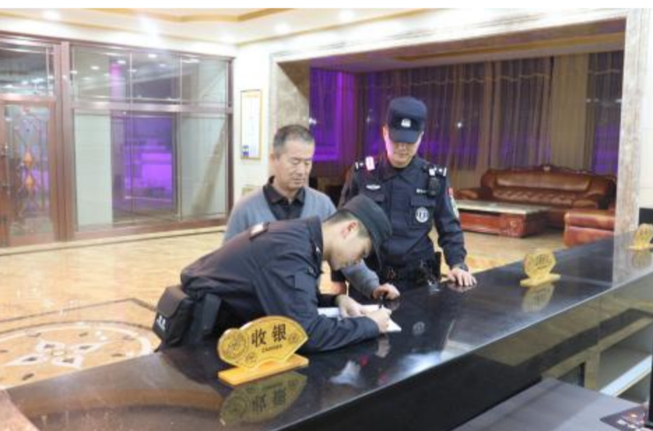
11月20日,内蒙古大兴安岭森林公安局甘河分局开展冬季行动夜间巡查,及时发现和消除各类安全隐患。 图为特巡警在宾馆查看入住人员信息。

督;通过“三会一课”、主题党日等形式,组织党员干部开展党风廉政专题学习研讨,进一步增强纪律意识和拒腐防变能力;加大风险排查力度,对于梳理出的廉洁风险点进行分析研判,并提出“清单+闭环”的工作机制,确保工作中责任不掉链、问题不落空。