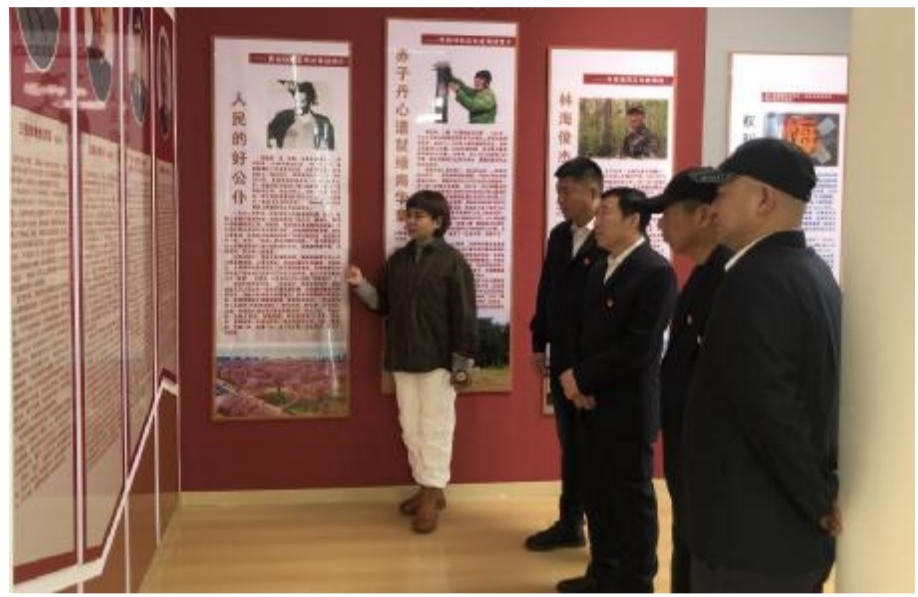
11月14日,大杨林业公司乃木河林场党支部组织党员到公司廉洁文化宣教室参观学习,强化党员干部廉洁自律意识。

灰吟》等诗歌,3名党员干部分享了“袁隆平质朴与执着一脉相承”“周恩来家风《十条家规》”等家风故事,督促党员干部常思己身,以优良家教家风涵养清正党风政风。 随后,大家走进公司职工图书馆,党支部选择《廉政家书》《浴火摇篮》等10本经典书籍,推荐给党员干部重点阅读,并为每名党员赠送廉洁文化书籍和廉洁寄语书签,鼓励党员干部多读书、读好书,随时接受廉洁文化熏陶,时刻提醒自己清静自守、履职尽责,共同营造风清气正的浓厚氛围。