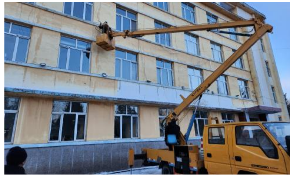
近日,阿龙山森工公司阿龙山经营管护中心组织职工维修院内的亮化彩灯,营造美丽、安全的环境。 图为职工更换损坏的线路。

该站结合生态功能区生长分布的针叶林面积、地理位置等实际情况,科学合理设计普查路线。检疫技术人员依据松材线虫病调查技术要求,对生态功能区内的松科林木开展详细普查,建立松材线虫病普查档案,做好整理外业普查记录、拍片等工作。同时,该站还通过标语、横幅、微信公众号等载体开展松材线虫病危害性以及防控的宣传,让职工群众了解松材线虫病的发生特征、危害、传播途径等相关知识,营造社会关注、群防群治的良好防控氛围。