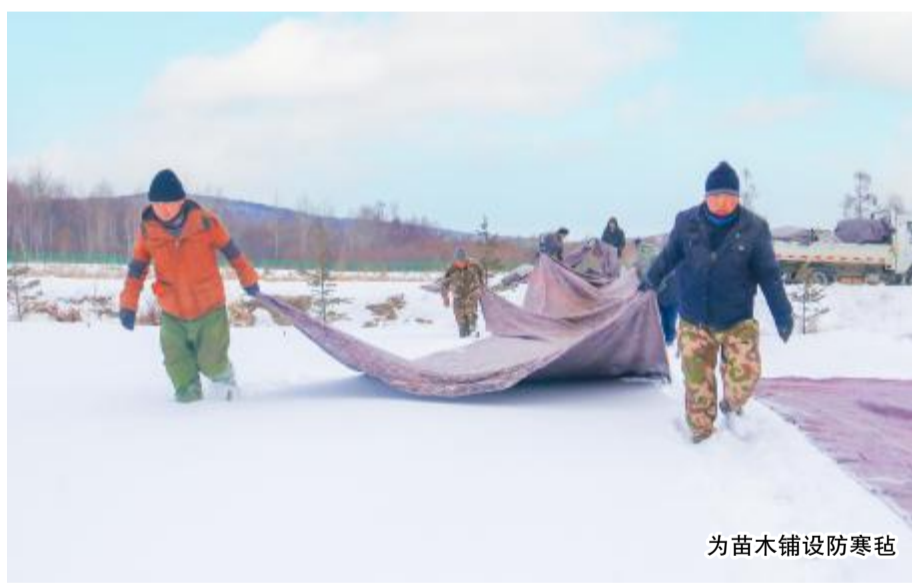
为苗木铺设防寒毡