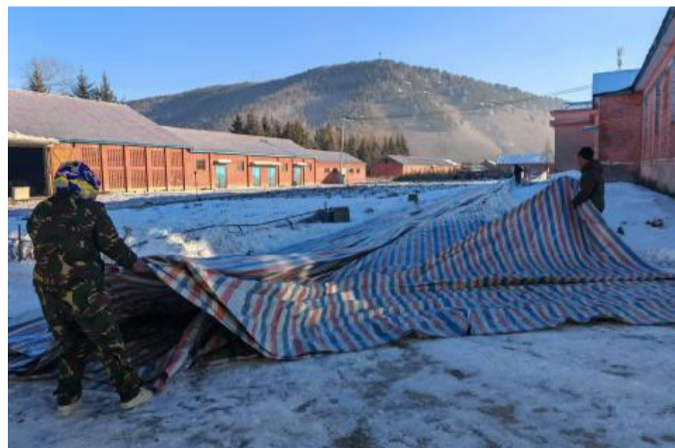
连日来,金河森工公司森林经营中心苗圃开展苗木防寒保暖作业,为园区内的落叶松、云杉、西伯利亚红松幼苗覆盖防寒布,护航苗木安全健康过冬。

本报讯(通讯员 刘时佳)11月21日,满归森工公司物资供应中心安全检查小组到油库对消防器材、各类仪器以及监控设施是否正常运行进行安全检查,避免因温度过低导致仪器损坏,造成安全隐患。