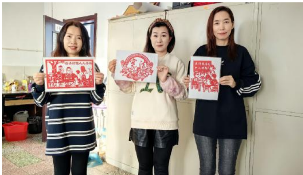
12月5日,根河森工公司开拉气经营管护中心党总支开展宪法学习宣传活动,将剪纸艺术与法治宣传融合起来,用“新剪法”述说法治“新说法”,号召职工尊法、学法、守法、用法。图为职工展示剪纸作品。

本报讯(通讯员 孙紫薇)近来,克一河森工公司霍都奇管护中心开展宪法宣传活动,弘扬宪法精神,维护宪法权威。 该中心通过张贴宣传海报及在电子屏循环播放宪法宣传标语,向职工宣传宪法及相关法律法规。同时,利用微信工作群组织职工观看“宪法的精神·法治的力量——2024年度法治人物”专题节目,拓展延伸学习渠道和阵地,营造浓厚学习氛围;组织职工集中学习《中华人民共和国宪法》,深入解读宪法的重要意义、主要内容和精神实质,提升职工的宪法意识和法治观念;组织新时代文明志愿者走上街头发放宣传资料,向群众普及宪法知识,引导群众理性表达利益诉求,学会运用法律的武器来保护自身合法权益。