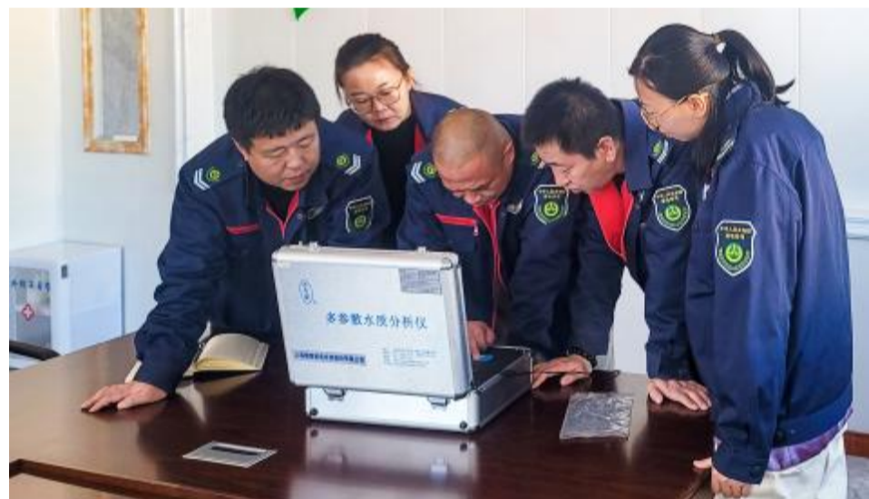
近日,乌拉旗汉森公司森林资源管理中心组织技术人员学习水质分析检测仪的操作和使用技巧,现场演示水质参数测量和测定流程,提高技术人员对仪器的使用熟练度。