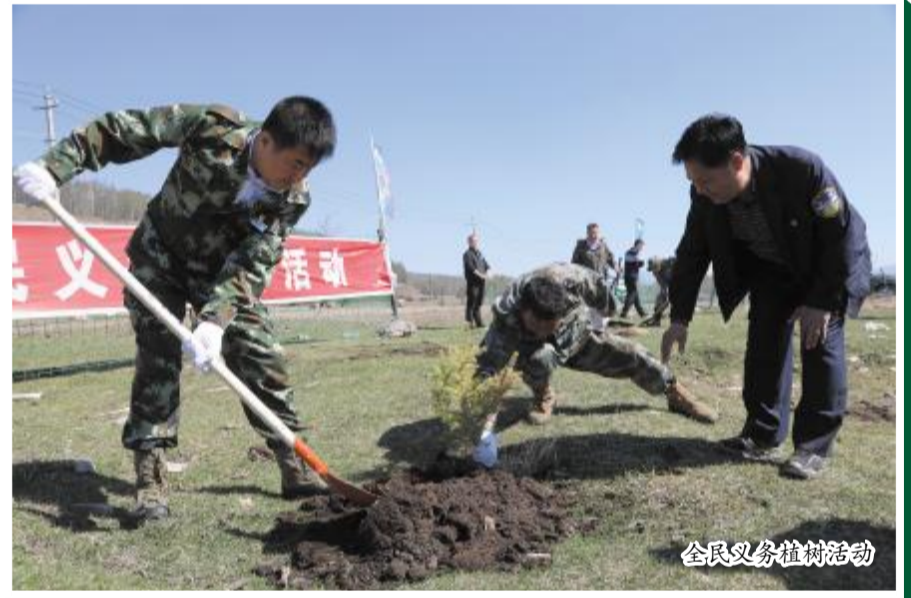
全员义务植树劳动

这是得耳布尔森工公司锐意进取、砥砺奋进的十年，千部职工用3600多个日夜的奋斗，谱写了绿色高质量发展的华丽篇章； 这是得耳布尔森工公司经济社会飞速发展发展的十年，千部职工精神风貌发生巨大的变化，处处焕发着蓬勃生机与无限活力。 在历史的长河里，十年只是沧海一粟，对于一个企业，却能见证其从莽路蓝缕到五次于成的蜕变。在这十年间，得耳布尔森工公司森林资源有效管护，生态功能不断提升；产业结构优化调整，绿色发展加快推进；深化改革取得实效，企业发展提质增效；牢固树立宗旨意识，民生福祉持续增进；党的建设全面加强，政治生态持续向好；文体活动竞相发展，文化自信更加坚定。