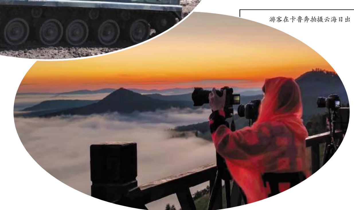
游客在卡鲁奔拍摄云海日出