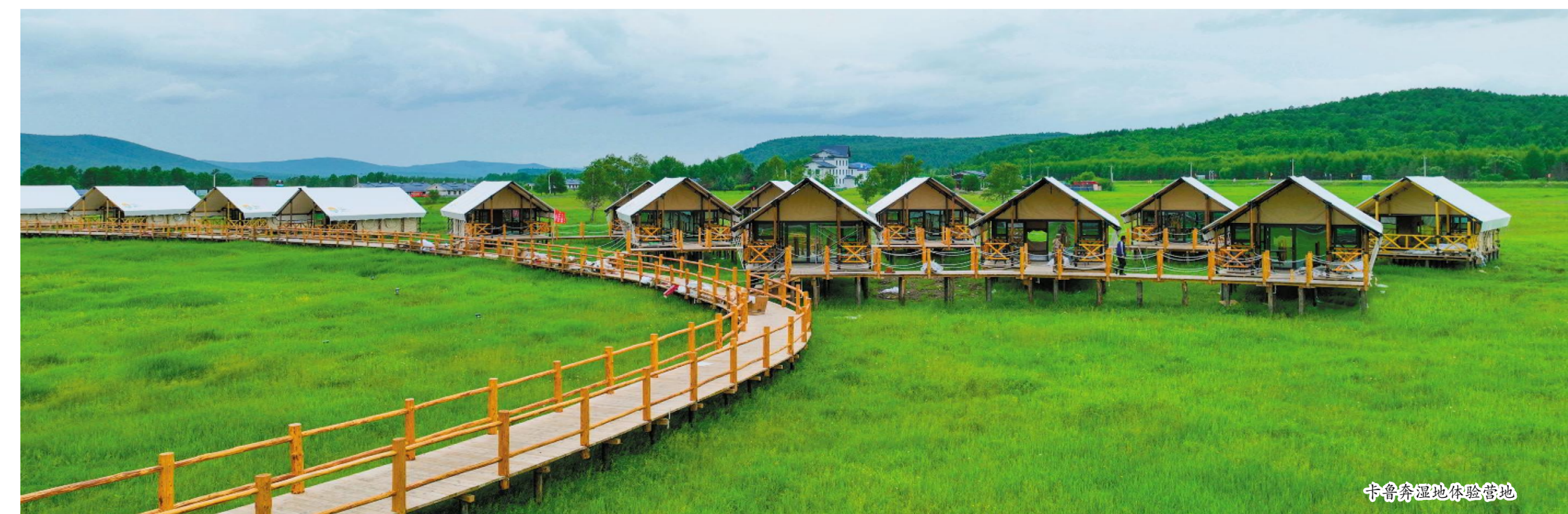
卡鲁奔湿地旅游营地