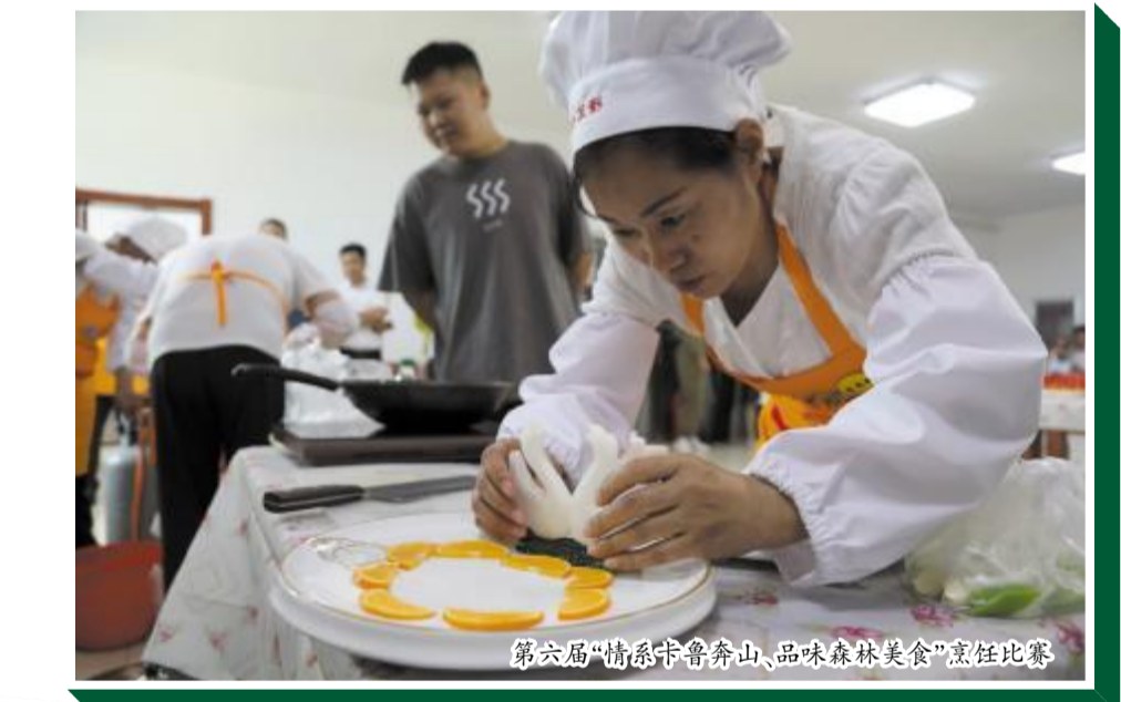
第六届职工厨艺大赛，品味森林美食烹饪比赛

这是得耳布尔森工公司锐意进取、砥砺奋进的十年，千部职工用3600多个日夜的奋斗，谱写了绿色高质量发展的华丽篇章； 这是得耳布尔森工公司经济社会飞速发展发展的十年，千部职工精神风貌发生巨大的变化，处处焕发着蓬勃生机与无限活力。 在历史的长河里，十年只是沧海一粟，对于一个企业，却能见证其从莽路蓝缕到五次于成的蜕变。在这十年间，得耳布尔森工公司森林资源有效管护，生态功能不断提升；产业结构优化调整，绿色发展加快推进；深化改革取得实效，企业发展提质增效；牢固树立宗旨意识，民生福祉持续增进；党的建设全面加强，政治生态持续向好；文体活动竞相发展，文化自信更加坚定。