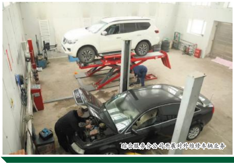
游客服务中心维修中心汽车维修