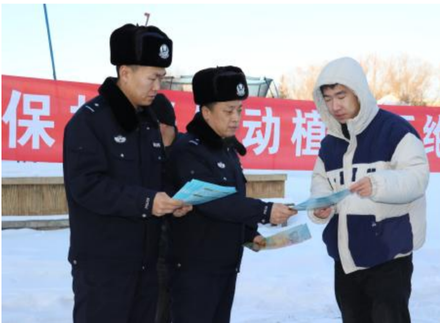
近日,内蒙古大兴安岭森林公安局毕拉河分局江西派出所组织民警深入辖区开展冬季社会面治安巡防专项行动。

行动中,民警深入额尔肯村、兰巴库以及周边地区排查野生动物栖息地是否有猎捕野生动物工具,是否存在乱砍滥伐、乱捕滥猎、乱采滥挖等涉林违法犯罪行为。同时,向群众宣传生态资源保护、野生动物保护、森林防火等法律法规和政策,鼓励群众积极举报违法犯罪行为。