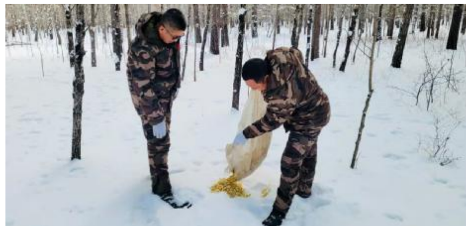
入冬以来,红花尔基地区多极寒天气,积雪深厚,部分天然草场被积雪覆盖,栖息在此的貉、雪兔、狍子、野猪等野生动物面临食物匮乏等问题。红花尔基樟子松林国家级自然保护区管理局通过定期多点投放饲料的方式,帮助野生动物安全度过寒冬。