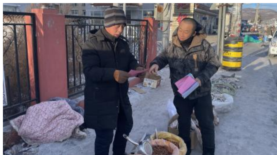
春节前夕,巴林林业局联合牙克石市公安局巴林森林公安分局开展打击整治非法野生动物贸易执法行动。执法人员到喇嘛山超市、巴林快递驿站、巴林邮局、饭店等重点场所,通过现场检查、询问等方式,检查是否存在非法寄递、买卖、食用野生动物及其制品等情况,向群众宣传讲解野生动物保护法律法规,督促经营主体自觉抵制非法寄递野生动物及其制品等违法行为,维护生态安全和公共卫生安全,严惩破坏野生动物资源违法犯罪行为。