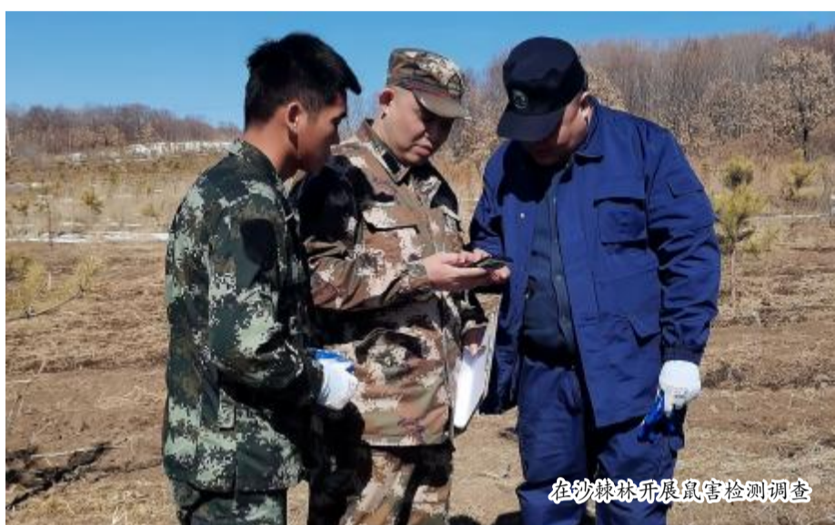
在沙棘林开展鼠害检测调查