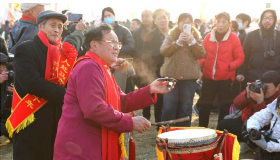
2月10日,艺人在书会上表演。

当天,伊朗全国各地民众走上街头,纪念伊朗伊斯兰革命胜利46周年。