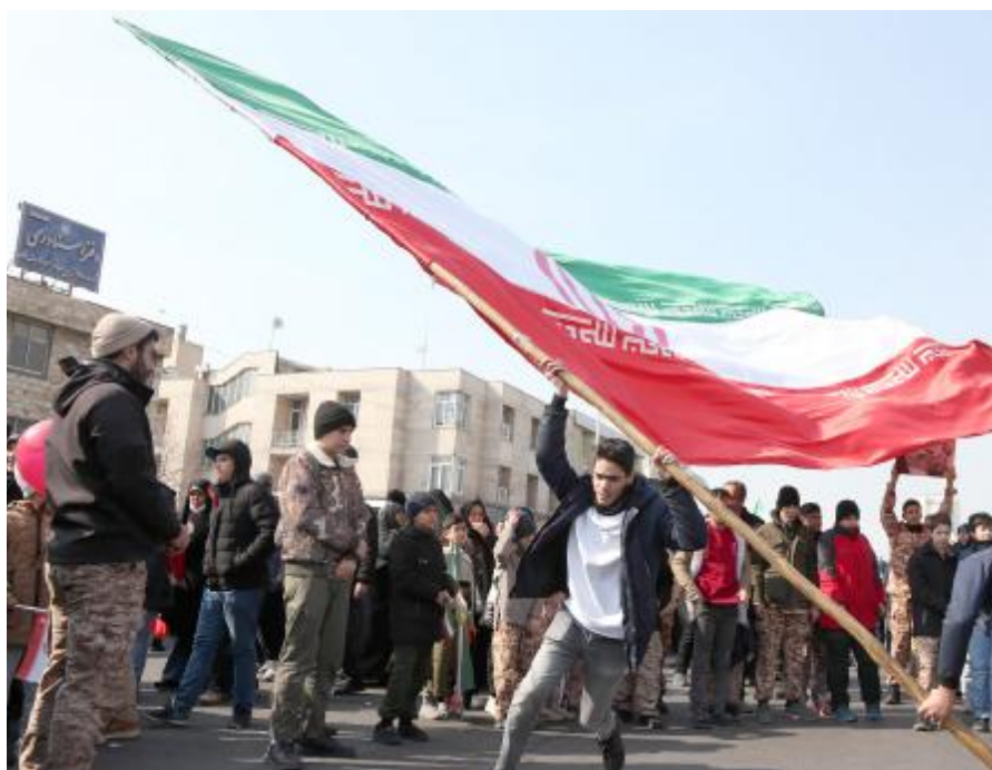
2月10日,在伊朗首都德黑兰街头,民众参加纪念伊朗伊斯兰革命胜利46周年集会。

当天,伊朗全国各地民众走上街头,纪念伊朗伊斯兰革命胜利46周年。