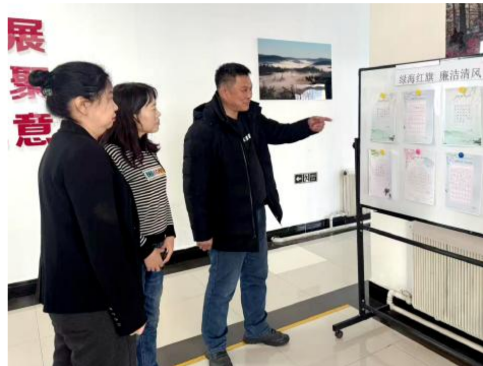
近日,莫尔道嘎森工公司红旗经营管护中心举办“绿海红旗 廉洁清风”承诺书法展,推进廉洁文化建设,强化党员干部廉洁自律意识。图为党员员工观看展板。

纪检干部纷纷表示,作为党的“纪律部队”,要严格按照党章党规党纪,对照反面典型,深刻自我反省,固本培元、防微杜渐,增强拒腐防变能力。要始终发扬自我革命精神,自觉学纪、知纪、明纪、守纪,保持政治定力、锤炼过硬作风,提升业务能力,自觉接受最严格的约束和监督,始终做到绝对忠诚、绝对可靠、绝对纯洁、永葆忠诚干净担当、敢于善于斗争的铁军本色。要巩固拓展规范化法治化正规化建设成果,进一步完善纪检制度规范体系建设,严格按照权限、规则、程序开展工作,依规依纪依法履行职责,自觉传承党的优良传统和作风,带头发扬“真严细实快”工作作风,共同推动林区纪检工作高质量发展。