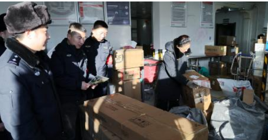
抽查标注“特产”“山货”的包裹