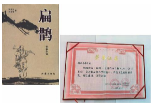
（图为作者编著出版的《扁鹊》长篇小说书和获奖证书）

我把书稿交给作家出版社。作家出版社是文学界最高出版社，像我这样基层二流作家，很难在作家出版社出版长篇小说的。我怀着忐忑不安的心情，等待着他们退稿。我没想到长篇小说获得通过，编审告诉我，你这部长篇小说篇章结构、文字功底，达到了出版水平。但批准你出版的主要原因，是因为它是国内第一部反映扁鹊的长篇小说。2012年，长篇小说《扁鹊》由作家出版社出版，获得邢台市（2011年—2013年度）首届文艺创作繁荣奖。