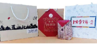
（图为第三届中医药文化大会药膳贵和礼品盒照片）