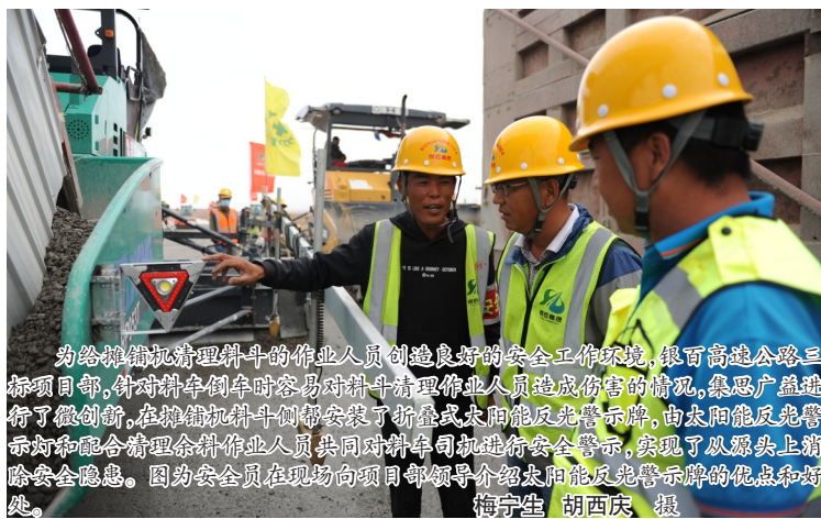
为给摊铺机清理料斗的作业人员创造良好的安全的工作环境,银百高速公路三标项目部,针对料斗作业时容易对料斗清理作业人员造成伤害的情况,集思广益进行了微创新,在摊铺机料斗侧都安装了折叠式太阳能反光警示牌,由太阳能反光警示牌和配合清理料斗作业人员共同对料斗司机进行安全警示,实现了从源头上消除安全隐患。图为安全员在现场向项目部领导介绍太阳能反光警示牌的优点和好处。

6月11日,宁夏交通物流园C1库伟杰物流货物突发火灾,浓烟弥漫、人员被困,园区内义务消防队迅速赶到火灾现场控制火情……当天,宁夏交通物流园区开展了2019年夏季消防演练,目的是提高入驻商户的消防安全意识,掌握扑灭初期火灾的技能。 此次消防应急演练成立了临时应急指挥中心,下设抢救组、警戒疏散组、灭火组、后勤保障组等多个小组。演练共分为火灾报警、火灾时疏散逃生及消防灭火三个环节进行。 据宁夏交通物流集团有限公司相关负责人介绍,宁夏交通物流园入驻客户200多家,均从事物流运输行业,消防安全形势十分严峻,该公司对消防安全特别重视,成立了两支义务消防队,配置了4台专业消防车,制定了相关的安全管理制度,每年 组织消防员、物流园的客户和消防队进行大型的消防演练不少于两次,每月对商户进行安全教育培训,以进一步提高员工和商户的消防安全意识与消防队之间协同合作能力,锻炼安全员队伍和商户保管员消防技能。(梅宁生)