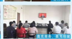
奥克商务、奥克包装