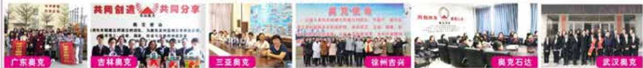
广东奥克 吉林奥克 三亚奥克 徐州吉兴 奥克石达 武汉奥克