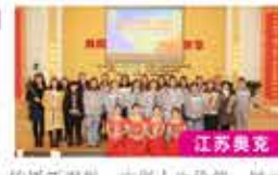
江苏奥克 传播新思想，实现人生价值，展示巾帼风采！ (党群工作部 韩光)

蹈或唱歌，展现了奥克女员工开朗、积极向上、精神面貌。会后，各公司分别组织了丰富多彩的自行活动，让女员工们度过一个愉快的节日。此次活动充分体现了公司对女员工工作的感谢和关爱，使大家感受到节日带来的欣喜和信任，进而鼓励女员工们不断奋斗，弘扬正能量，