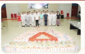
场包饺子、打蛋蛋，欢声笑语，洋溢着浓浓的节日喜悦。此次中秋慰问让坚守在工作岗位和未回家与家人团聚的职工倍感温暖，他们纷纷表示感谢公司的关心，会继续做好本职工作，以更加饱满的精神面貌投入到工作中去，为奥克的高质量发展贡献出自己的力量。（奥克股份 唐艳娟）

慰问结束后，在美丽的胥浦家园，江苏奥克党总支、江苏奥克工会、扬州公司综合办组织来自外地的未回家员工共度中秋，员工们现