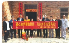
孩子们深受感动,热泪盈眶,深切感受到了奥克“共创共享,共和共荣”的企业文化关怀,决心在今后的成长道路上常怀感恩之心,务实进取,用优异的成绩回报社会以及关心帮助过他们的各位爱心人士。(广东奥克 张志良)

爱心无止境,助学见真情。广东奥克党支部全体党员用他们最真诚的热情与爱心去帮助需要的学生,为他们带去温暖和希望。受助