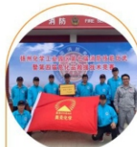
消防技能大比武 喜获佳绩再创优