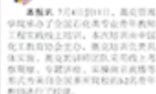
▲奥克管理学院承办的全国石化类专业青年教师工程实践线上培训正在顺利进行中。培训内容包括石化行业基础知识、工程实践案例分享等。

奥克管理学院承办的全国石化类专业青年教师工程实践线上培训正在顺利进行中。培训内容包括石化行业基础知识、工程实践案例分享等。培训旨在提高青年教师的工程实践能力，促进石化行业人才培养。奥克管理学院表示，将继续加大人才培养力度，为石化行业培养更多高素质人才。