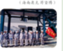
奥克绿色包装活性剂项目组获评“辽阳市巾帼示范基地”称号