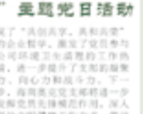
海南奥克党支部开展“清洁公司党员先行”主题党日

本报讯 1月19日，为进一步深化党建工作，发挥党员的先锋模范作用，海南奥克党支部开展“清洁公司党员先行”主题党日。