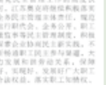
江苏奥克荣获扬州市企业务公开民主管理先进单位

本报讯 2023年度企业务公开民主管理先进单位评选工作，江苏奥克化学有限公司获评先进单位。