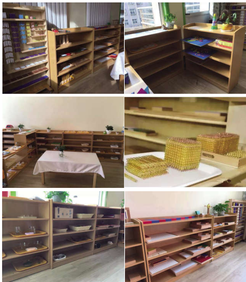
图为蒙氏教室各区照片

你印象中的课堂是什么样的?简洁的教室?整齐的桌椅?统一的课本?No~ No~ No~ 这些才不是我们的 feel 呢! 我们的课堂,是像家一样立体、温暖的! 我们的教室空间分布是多区并存的,为孩子尽可能的打造一个“小社会”雏形,让每个孩子都可以根据自己的特性,在接受完老师的教学后,自由选择学习活动的內容!