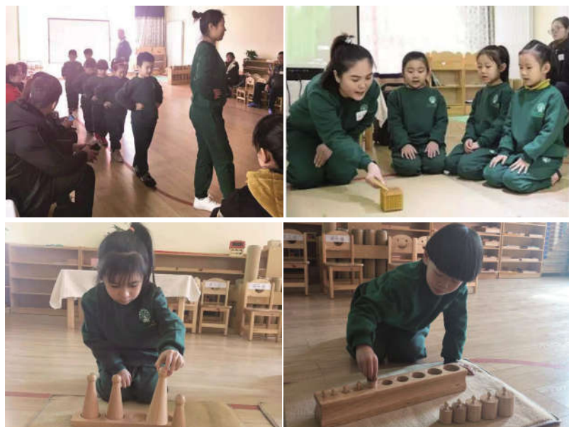
图为上课现场照片

课程开始前,老师会带领孩子进行“走线”——小朋友需要在舒缓的音乐中,以特定的步伐前进,并且途中要注意跟随老师进行动作变换。这样的课程设置不仅可以提高孩子的平衡能力,还能及时锻炼小朋友“自我调节专注力”的能力。在老师授课完成后,小朋友需要自己计划接下来的活动,主动去探索自己感兴趣的领域。这样的课程设置,可以在很大程度上激发孩子的学习自主性。