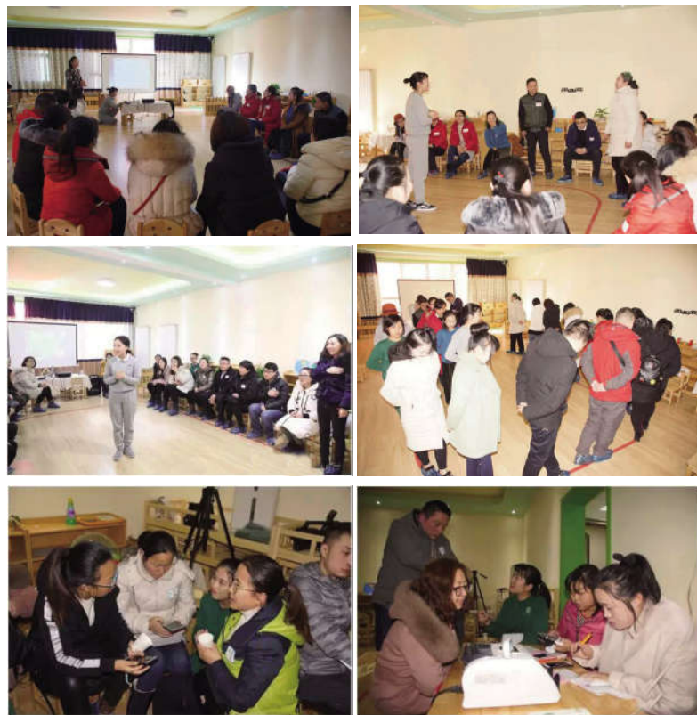
图为家长体验照片

近日,东城幼儿园还特别邀请香港跨世纪国际教育集团的专家,来幼儿园分享蒙氏教育的课程。据悉,东城幼儿园已经进行了数场蒙特梭利教育体验课,场场爆满,场场精彩,参课家长都对这种新式的育儿理念产生了浓厚的兴趣。